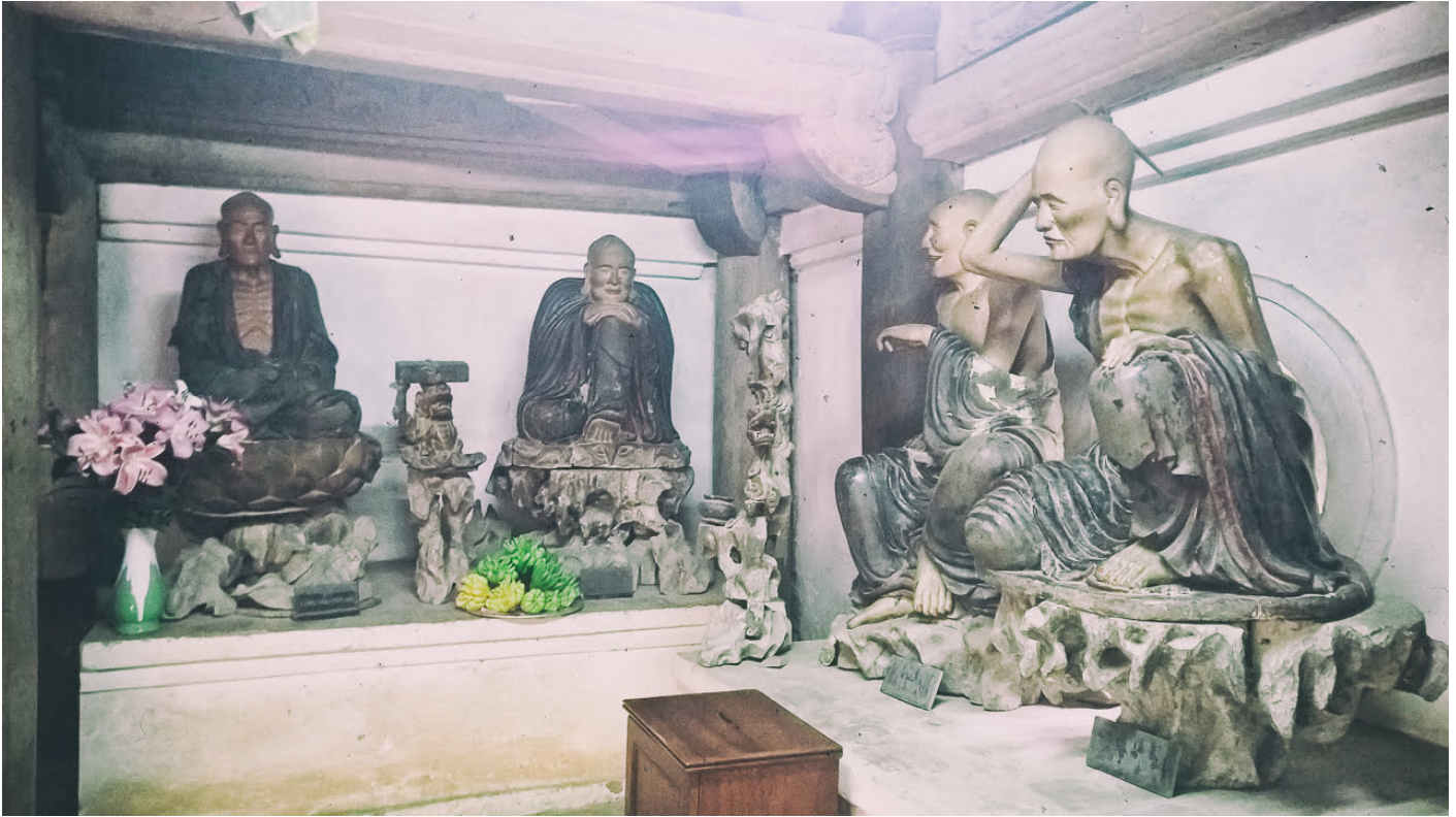
Hình tượng các vị La hán được đặt tại chùa Tây Phương

biến và đồng nhất nào nằm trong lòng con người hoặc sự vật. Vạn vật, trong đó có con người luôn chuyển biến, và vì vậy không vật nào có tính thường hằng hay chứa đựng một cái gì thường hằng.