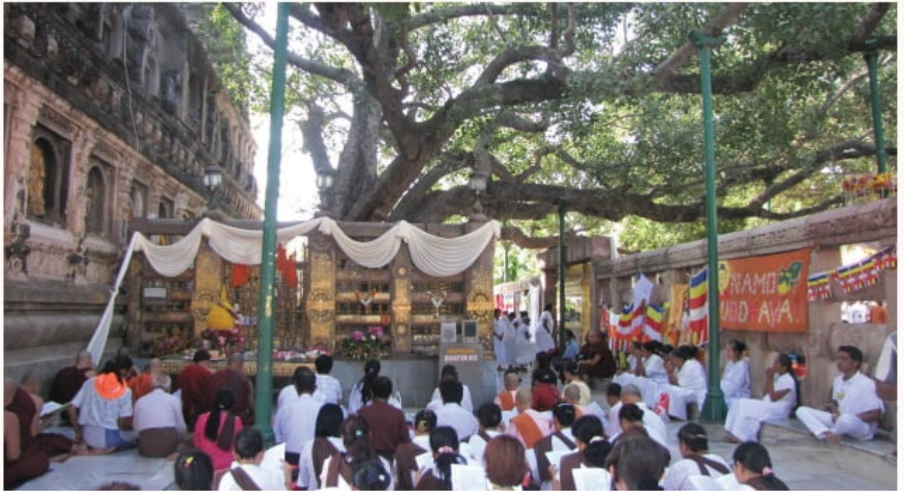
Buổi cầu nguyện bên tháp Đại Giác, Ấn Độ