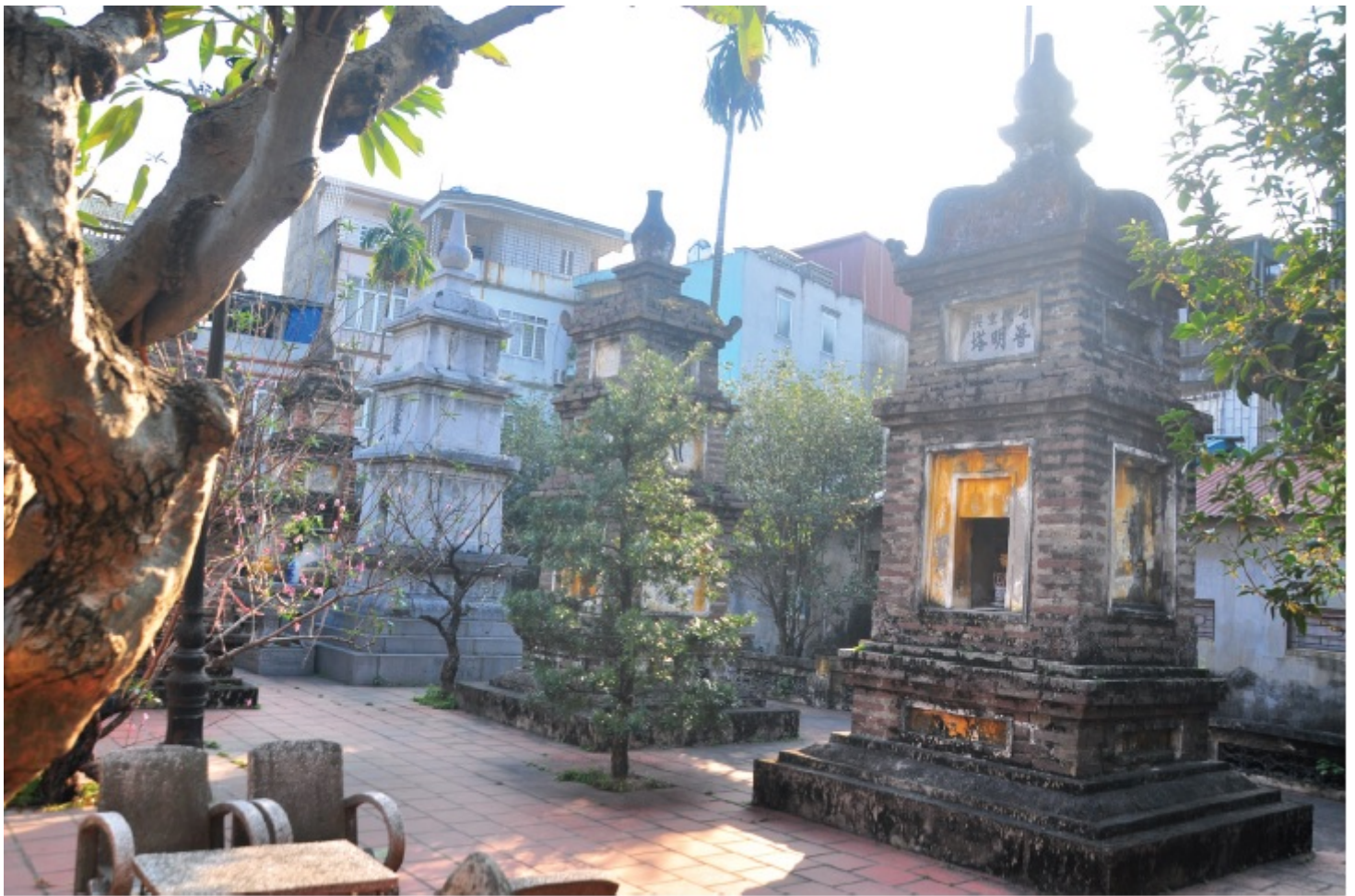
Vườn tháp chùa Liên Phái, Hà Nội

Phía sau Tam Bảo là nhà Tổ gồm 11 gian với 8 cửa lớn, kang trang rộng rãi, hệ thống tượng Phật trang nghiêm tố hảo, các bức hoành phi, câu đối đều rất đẹp, có ý nghĩa tán thán công đức của các vị chư Tổ.