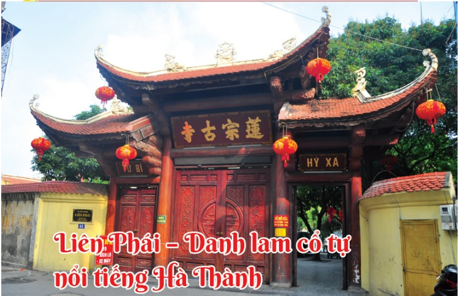
Tam quan chùa Liên Phái, Hà Nội

Cảnh vật thay đổi, ngõ đường rộng, nhiều ngôi nhà cao tầng được xây dựng nhưng chùa Liên Phái vẫn mang nét cổ kính, linh thiêng và là một trong những ngôi chùa nổi tiếng bậc nhất ở Hà Thành với cổng Tam quan uy nghi, lối kiến trúc giả cổ bề thế, mái lợp ngói.