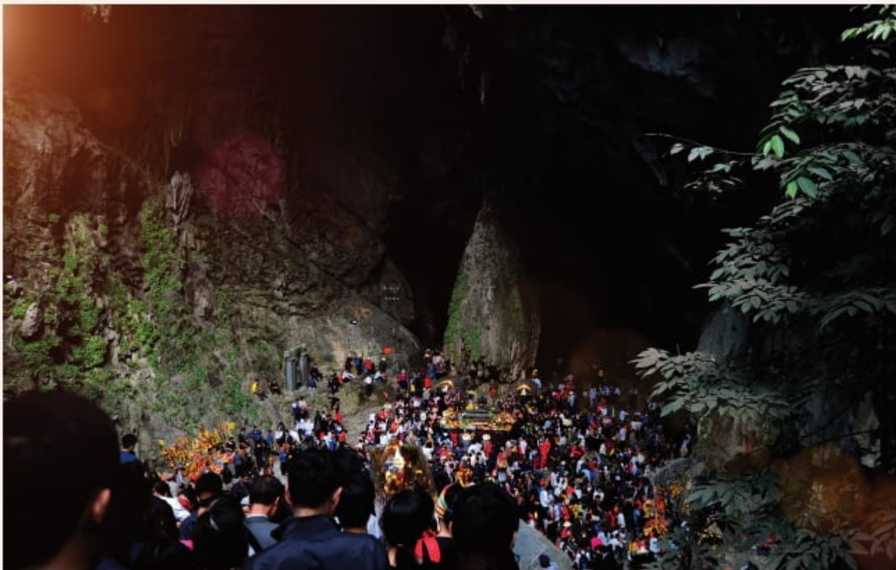
Phật tử du Xuân bái Phật tại động Hương Tích, Hà Nội

- Thân và đầu cúi rạp xuống là bảo ta phải khiêm tốn lễ độ không được kiêu căng, ngã mạn và hạ thấp cái tôi xuống vì nó chính là nguyên nhân gây khổ đau cho ta và cũng chính là chúa tể của vô minh dẫn ta chìm đắm trong lục đạo luân hồi.