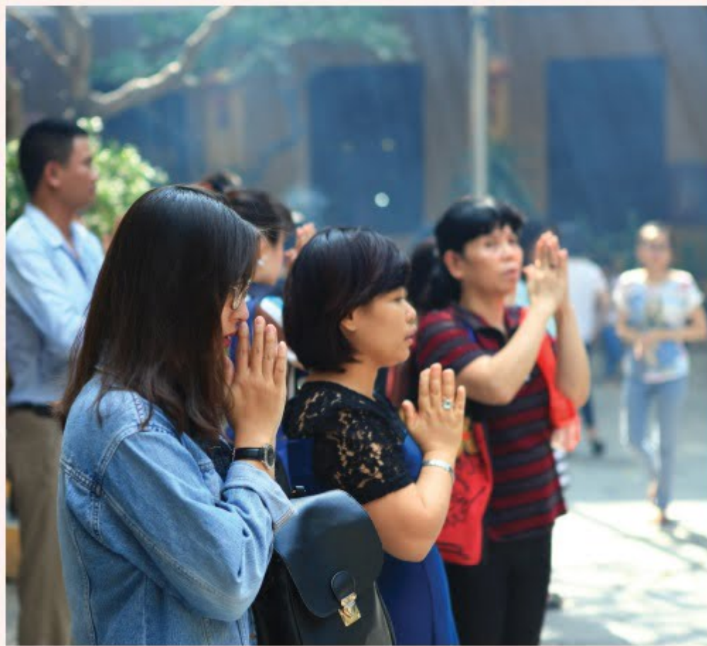
Lễ Phật chùa Quán Sứ, Hà Nội