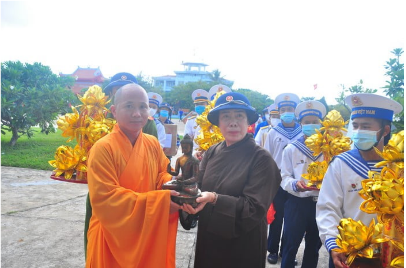
Phu nhân Đại tướng Phan Văn Giang, Bộ trưởng Bộ Quốc phòng cùng gia đình cung tiến tượng Phật.

Tại chùa Trường Sa Lớn, chúng tôi được tham dự lễ rước tượng Phật Dược Sư do phu nhân Đại tướng Phan Văn Giang, Bộ trưởng Bộ Quốc phòng cùng gia đình cung tiến.