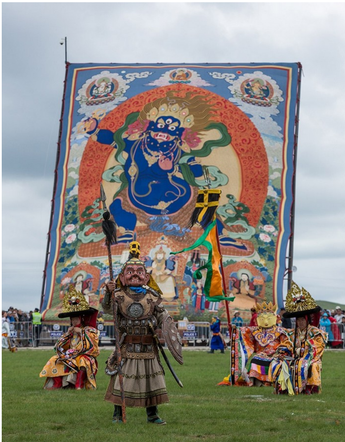
Phần độc đáo của Danshig Naadam Khuree Tsam là sự hiện diện cao quý của Đức Kim Cương