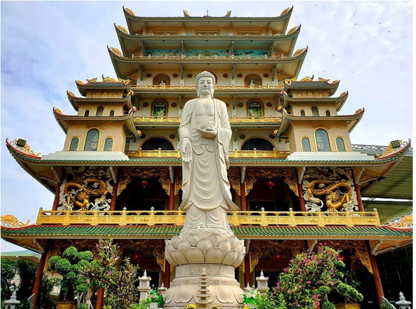
Chùa Vạn Đức, phường Tam Phú, Tp.Thủ Đức, Tp.HCM

Tuy nhiên nếu đã tạo sự nghiệp thì hãy như con NHẬN chứ đừng như con TẮM NHÀ TỜ rồi chết trong cái kén của nó.