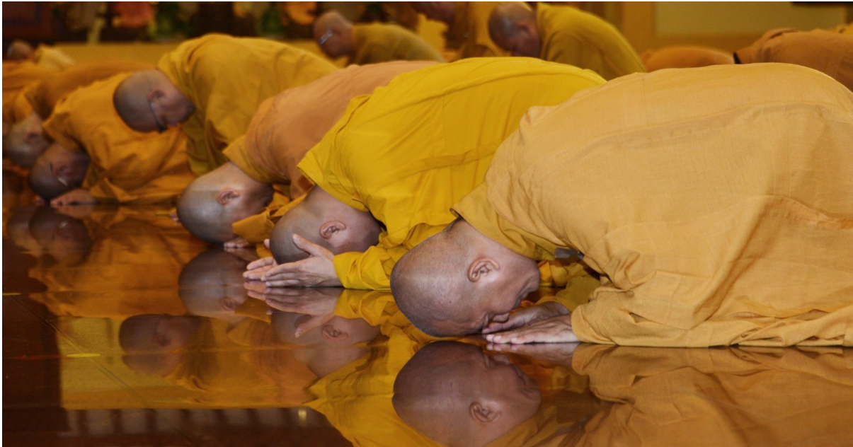
Hình ảnh chỉ mang tính chất minh họa.