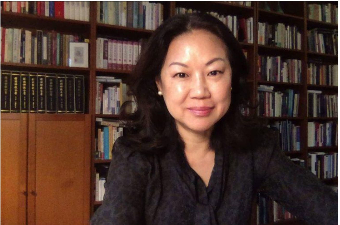
Giáo sư Jin Y. Park

Các cuộc họp thường niên là đỉnh cao trong các hoạt động của tổ chức, nhưng AAR tổ chức các hoạt động trong suốt cả năm, đặc biệt là thông qua các hội thảo online, các cuộc họp nội bộ hoặc theo từng chuyên đề, ấn bản nhiều ấn phẩm nghiên cứu, ấn phẩm truyền thông.