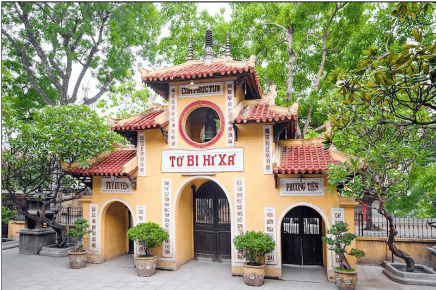
Chùa Quán Sứ (Hà Nội) nơi đặt Văn phòng 1 - Trung ương Giáo hội Phật giáo Việt Nam.