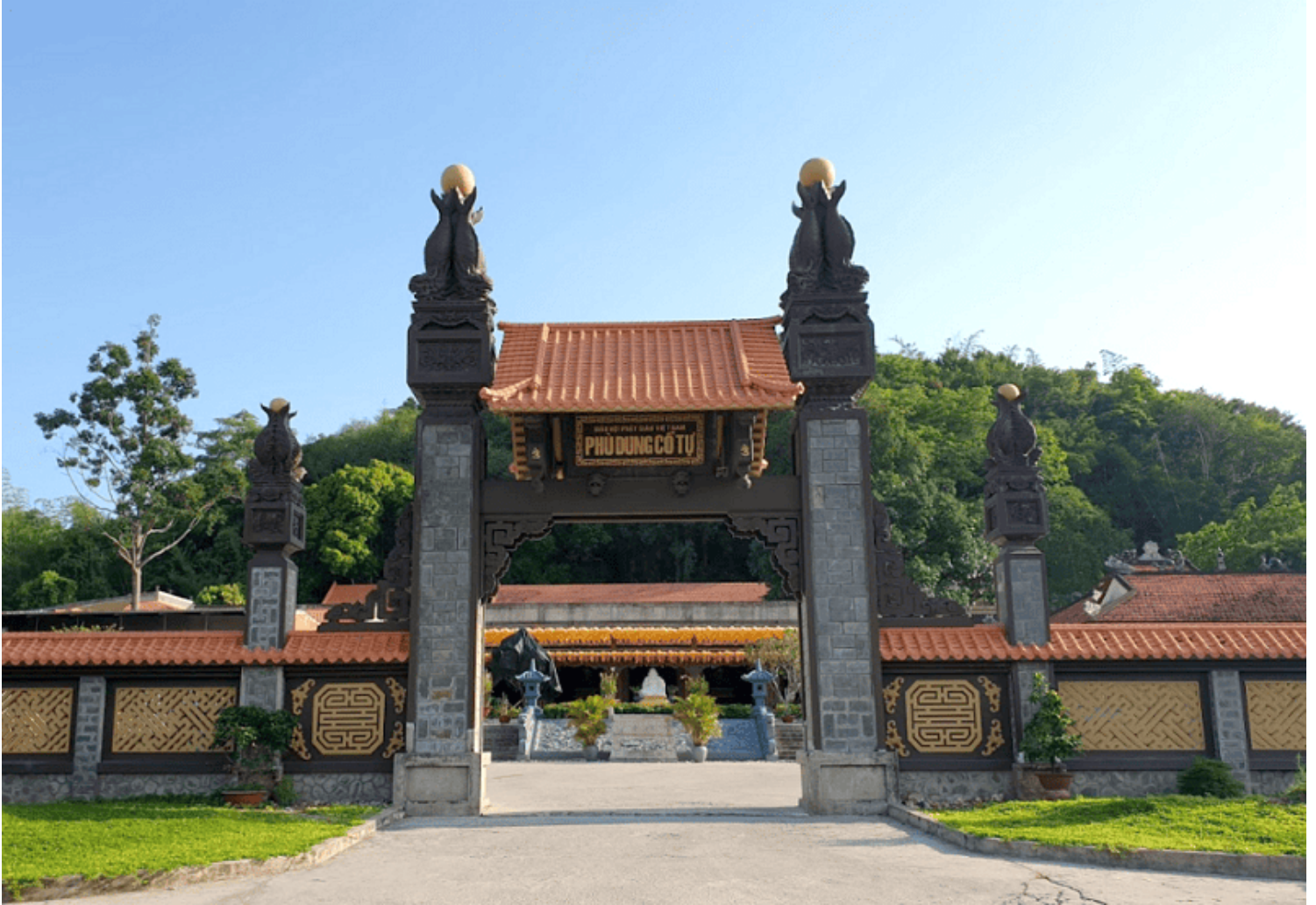
Phù Dung Cổ Tự (nay phường Bình San, Thành phố Hà Tiên)