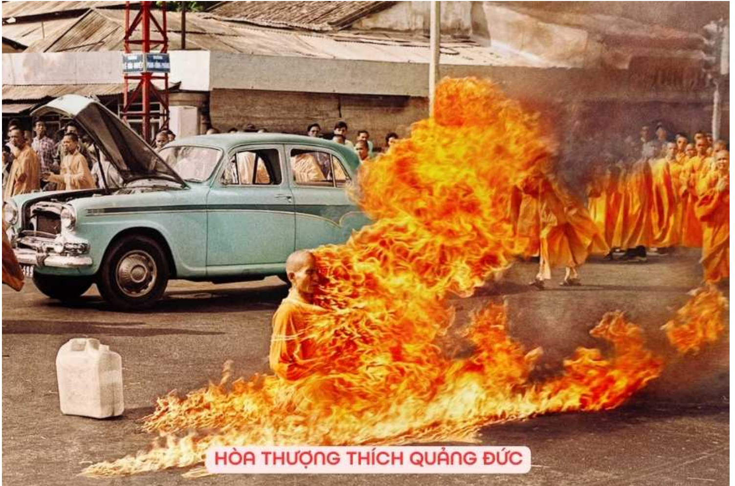
Hình ảnh Hòa thượng Thích Quảng Đức tự thiêu

Từ một cuộc diễn hành của trên 800 vị Thượng tọa, Đại đức, Tăng Ni và Phật tử từ chùa Phật Bửu đến chùa Xá Lợi, khi đoàn diễn hành tiến đến ngã tư đường Phan Đình Phùng và Lê Văn Duyệt (nay là đường Nguyễn Đình Chiểu và CMT8), Ngài từ trên xe hơi bước xuống, tự tắm xăng thấm ướt mấy lớp cà sa, ngồi kiết già xuống mặt đường, tự châm lửa giữa hàng mấy trăm Tăng Ni đang vây quanh chấp tay cầu nguyện. Ngọn lửa bốc cao, phủ kín thân mình, Ngài vẫn an nhiên chấp tay tĩnh tọa.