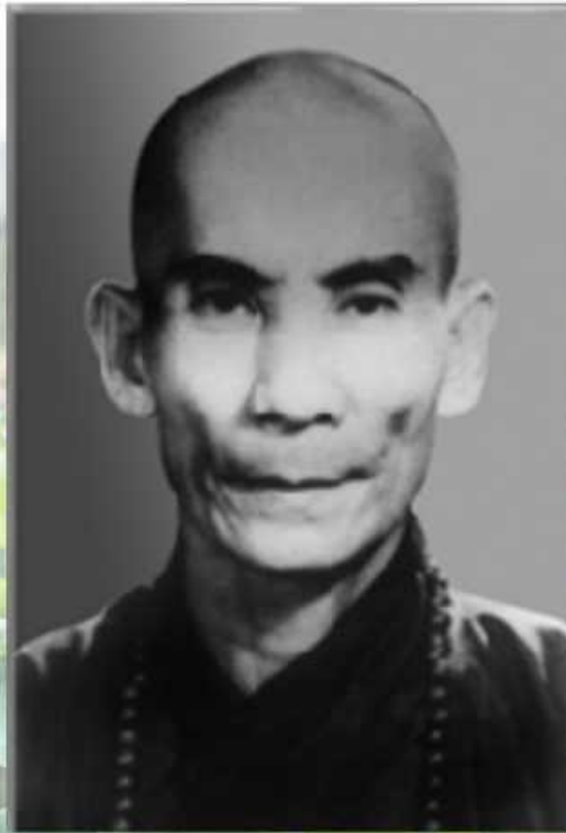
HÒA THƯỢNG THÍCH QUẢNG ĐỨC (1897 - 1963)

Năm 1932 hội An Nam Phật Học ra đời, Đại lão Hòa thượng chùa Hải Đức đến nơi Ngài đang nhập thất, mời ngài nhận chức Chứng minh Đạo sư cho Chi Hội Ninh Hòa. Ba năm sau, Ngài được thỉnh cử giữ chức Kiểm Tăng cho Tỉnh hội Khánh Hòa. Trong thời gian hành đạo tại miền Trung, Ngài đã kiến tạo và trùng tu tất cả 14 ngôi chùa.