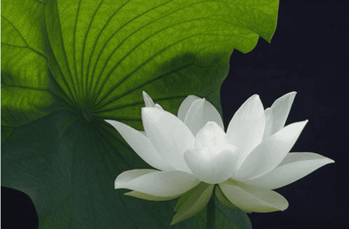
Một đài sen trắng

Một vần thơ cũ im lìm Trở màu trong cõi ao thiền trong veo Ta như chiếc lá xanh bèo Một hôm sợi nắng nương theo bóng mình.