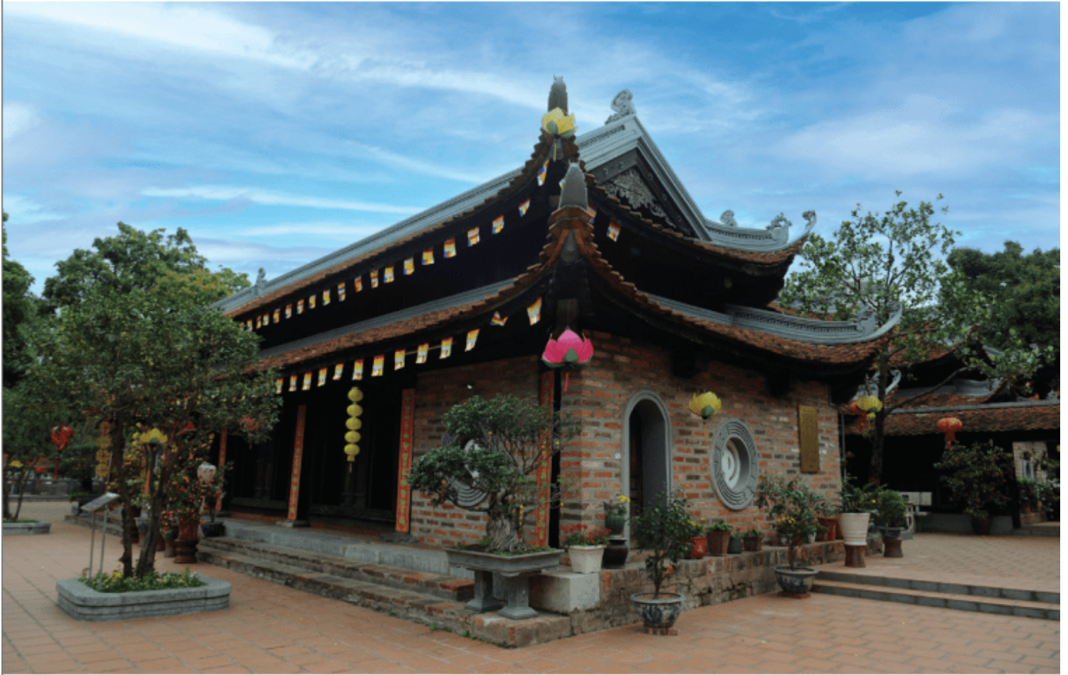
Chính điện chùa Kim Liên (Hà Nội)

Có người thấu triệt, bùn lầy nước đọng và không gian mênh mông vốn chỉ là hai mặt đối đãi không thật có; nếu nhận ra mầm hoa tại hiện tiền, thì tức khắc hoa sen nở. Đó là tinh thần Đốn ngộ của Lục Tổ Huệ Năng: Phật pháp ngay tại thế gian, không thể xa lìa thế gian tìm cầu sự giác ngộ.