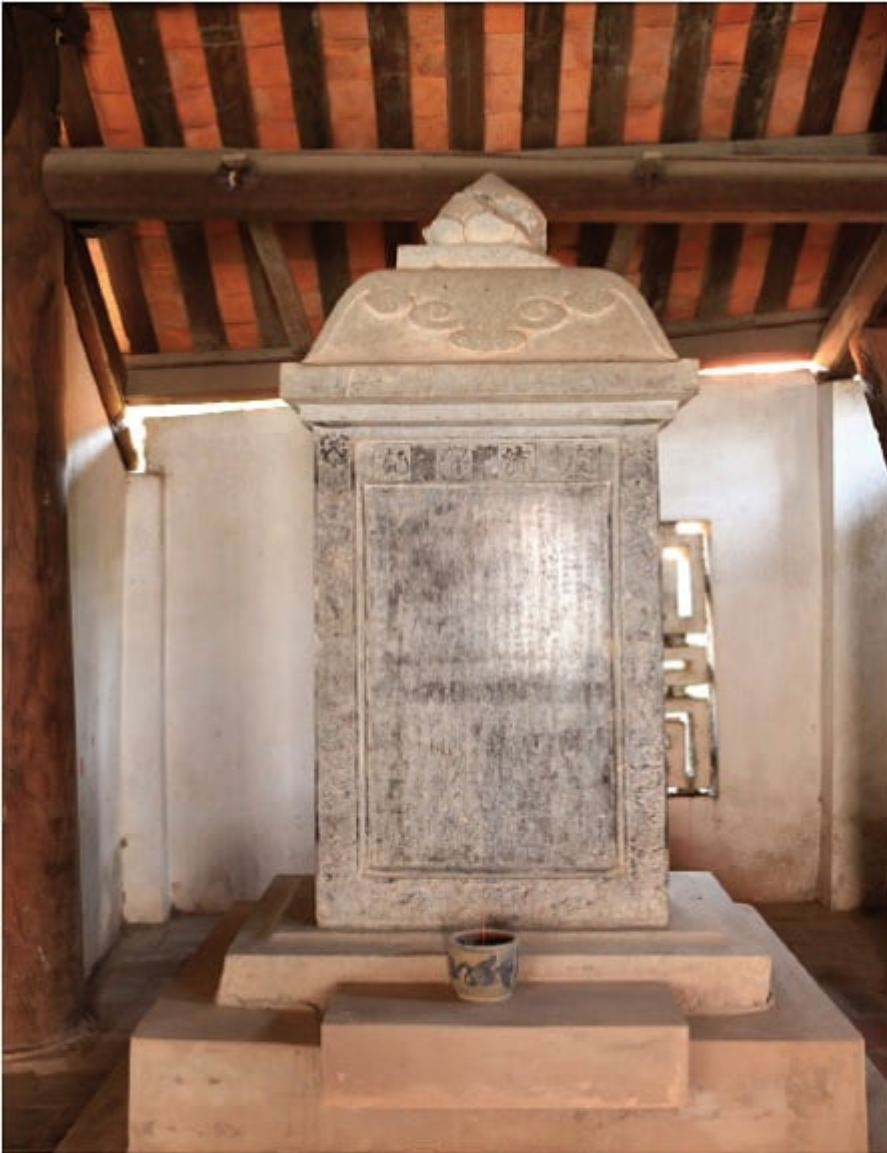
Văn bia chùa Bút Tháp - Ảnh: Minh Minh

Bài minh trên chuông chùa Ninh Phúc (Ninh Phúc tự chung); ngày tốt tháng 10 năm thứ 14 niên hiệu Gia Long (1815).