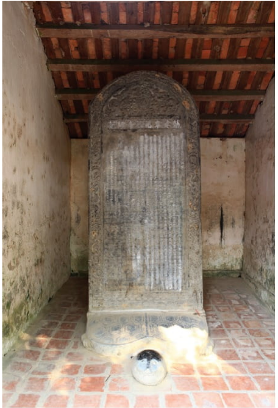
Văn bia chùa Bút Tháp

Hai tấm bia trên đều đặt trên lưng rùa thân dài 2,5m, rộng 1,20m, dày 0,26m loại rùa thân ngắn, mai gộp rùa có đường gờ cao, đầu mập, cổ rụt.