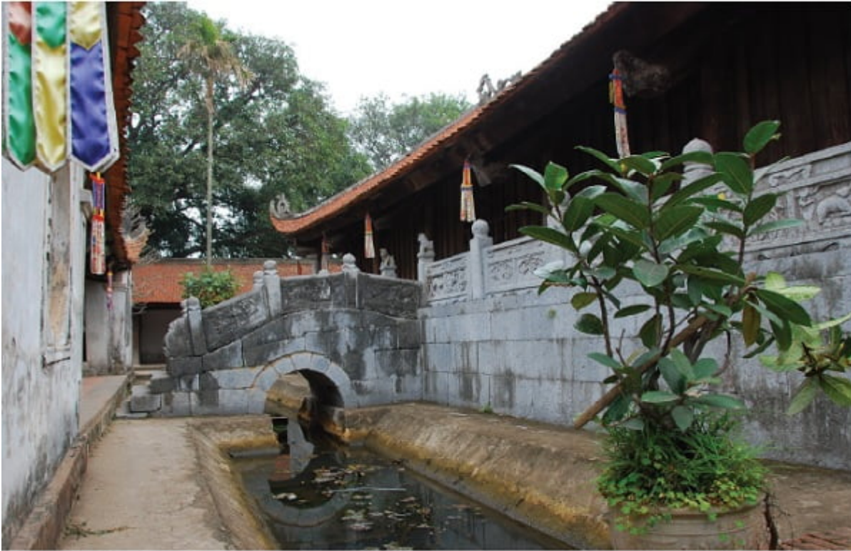
Cầu đá phía sau thượng điện chùa Bút Tháp