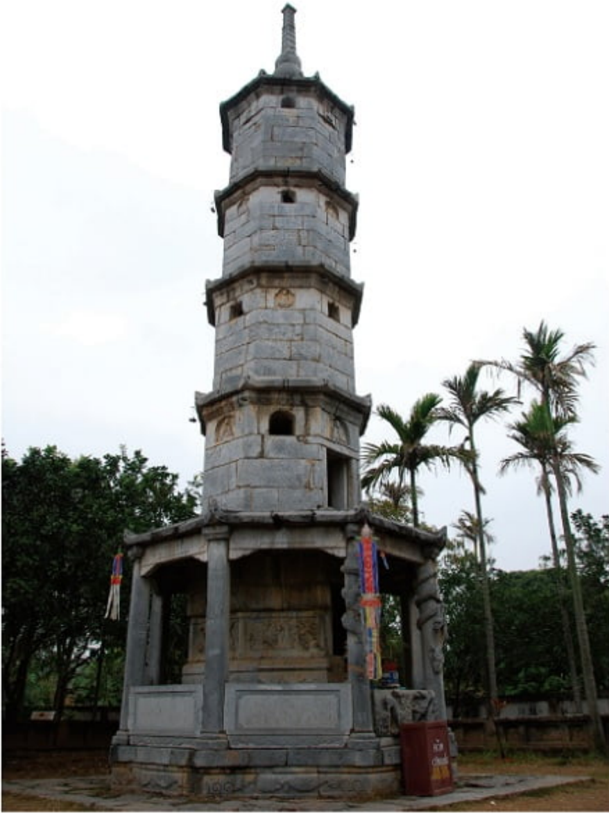
Tháp Báo Nghiêm, chùa Bút Tháp