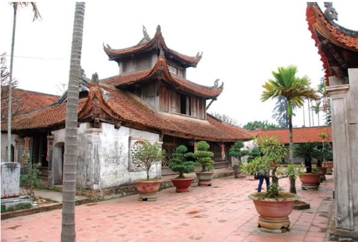
Am Tích Thiện, Chùa Bút Tháp