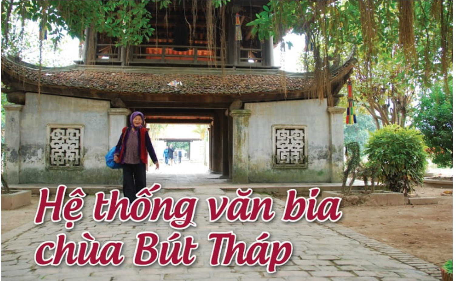
Gác chuông chùa Bút Tháp

Tỳ khiêu Thích Thanh Sơn Trụ trì chùa Bút Tháp