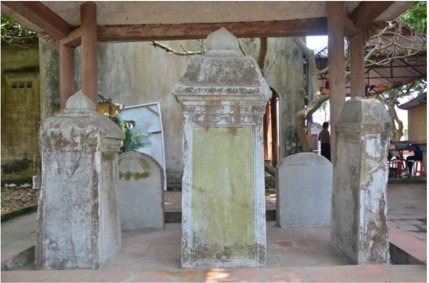
Hệ thống bia đá đặt tại chùa Giáo Đường

phải chăng xưa kia chùa Giáo Đường có tên chữ là Diên Phúc tự