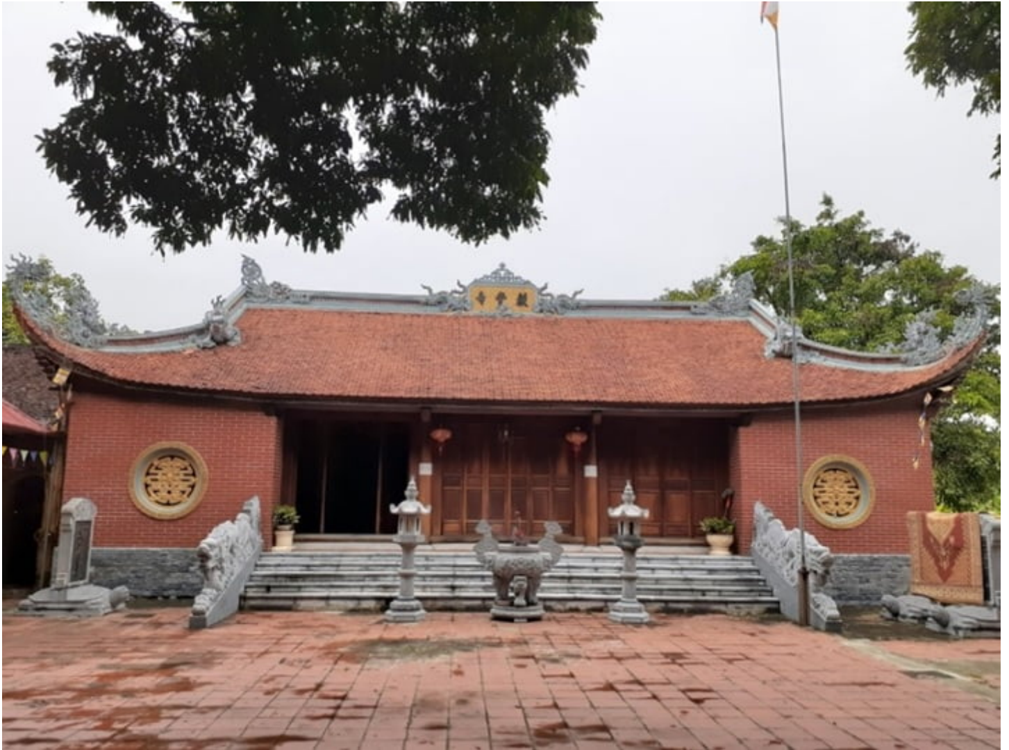
Tam bảo chùa Giáo Đường

Chùa Giáo Đường từng là một trong những trung tâm Phật giáo lớn, nơi đào tạo các tăng, ni cho nhiều chùa ở vùng Kinh Bắc xưa. Ngoài thờ Phật chùa còn thờ Thiền sư Nguyễn Minh Không - Quốc sư dưới triều vua Lý Thần Tông (1128 - 1138). Chùa có niên đại khởi dựng từ lâu đời, dưới thời Lê Trung Hưng được mở rộng với quy mô to lớn gồm nhiều hạng mục công trình kiến trúc. Trong kháng chiến chống Pháp (năm 1947) chùa bị phá hủy hoàn toàn. Khi hòa bình lập lại (năm 1957) nhân dân địa phương khôi phục lại chùa gồm các công trình: Tam bảo, nhà Tổ, nhà Mẫu, nhà tạo soạn, nhà bia... Công trình kiến trúc chính là Tòa Tam bảo được xây dựng lại vào năm 2015 có mặt bằng kiểu chữ Đinh, quay hướng Đông Nam, gồm Tiền đường 5 gian, Thượng điện 2 gian theo lối “tàu đao lá mái”. Toàn bộ khung nhà làm bằng gỗ lim, kết cấu vì kèo theo kiểu “chông dường giá chiêng”, trang trí chạm khắc trên các cấu kiện gỗ đề tài “tứ linh”, “tứ quý”, vân mây, hoa lá cách điệu theo phong cách nghệ thuật truyền thống.