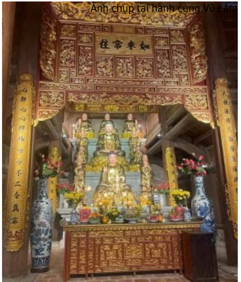
Ảnh chụp tại hành cung Vũ Lâm

Tháng 10 năm Kỷ Hợi (1299), Ngài tiếp tục tu hành ở núi Yên Tử (nay thuộc tỉnh Quảng Ninh). Ở đây, Ngài chuyên cần tu tập theo hạnh đầu đà (khổ hạnh), lấy hiệu là Hương Vân Đại Đầu Đà và truyền bá dòng thiền Trúc Lâm Yên Tử.