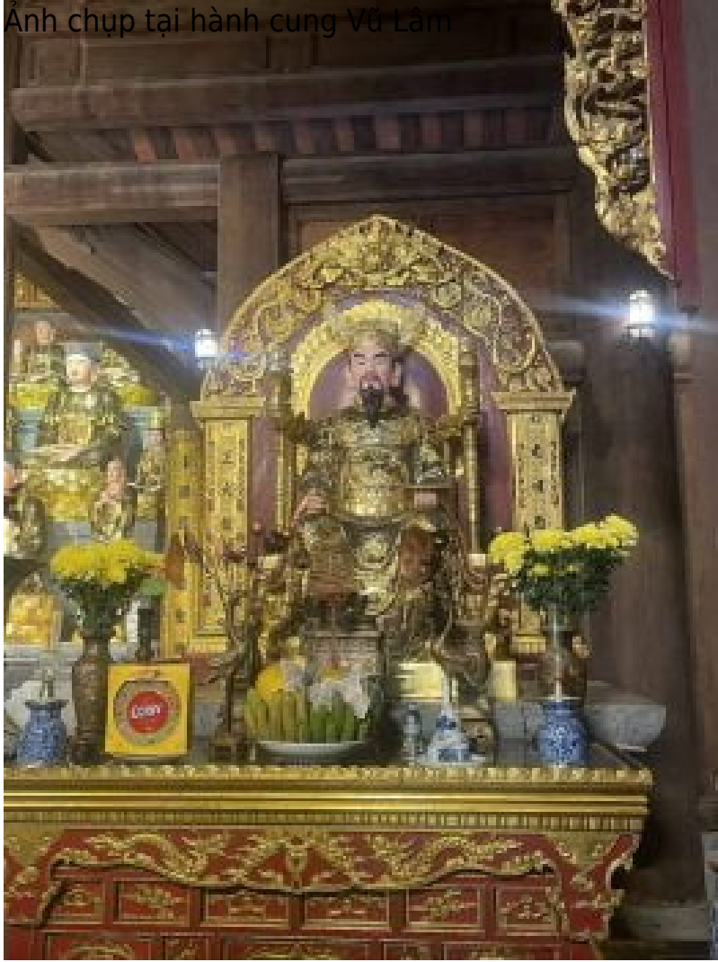
Ảnh chụp tại hành cung Vũ Lâm

Tiếp tục tâm nguyện độ sinh, Ngài đến chùa Phổ Minh ở Phủ Thiên Trường (nay thuộc tỉnh Nam Định) lập giảng đường để giảng dạy nhiều năm. Về sau, Ngài vân du đến trại Bồ Chính lập am Tri Kiến (nay thuộc tỉnh Quảng Bình) và ở lại đó. Tại đây, Ngài cũng đã hoàng dương Phật Pháp, làm lợi lạc cho chúng sinh.