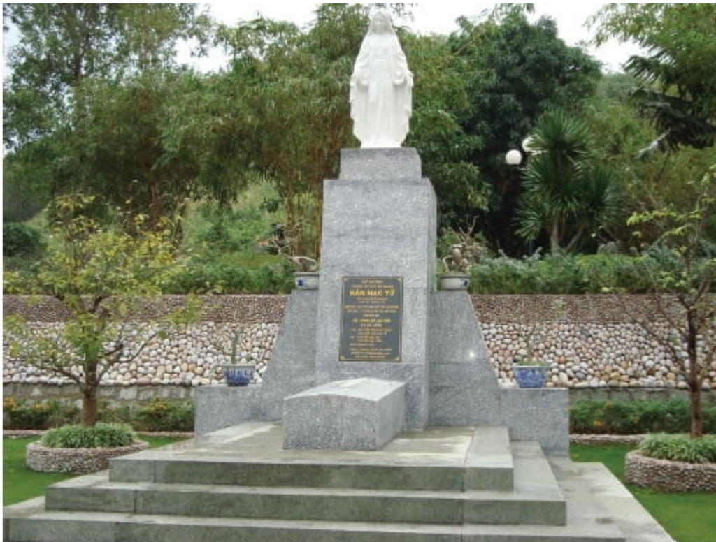
Mộ nhà thơ Hàn Mặc Tử

Và cõi đời này - mà Phan Thiết là tượng trưng - là nơi đau khổ, là nơi “chôn hận nghìn thu”, là nơi “sầu muộn ngất ngư”. Vì nhận biết cõi đời là giả tạo, là nơi khổ lụy, Tử đi tìm nơi giải thoát và đã tìm thấy cực lạc Quốc Độ của Phật A Di Đà.