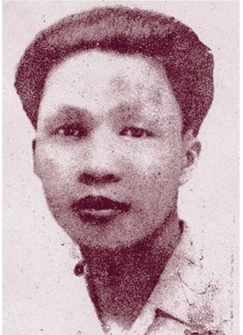
Chân dung nhà thơ Hàn Mặc Tử