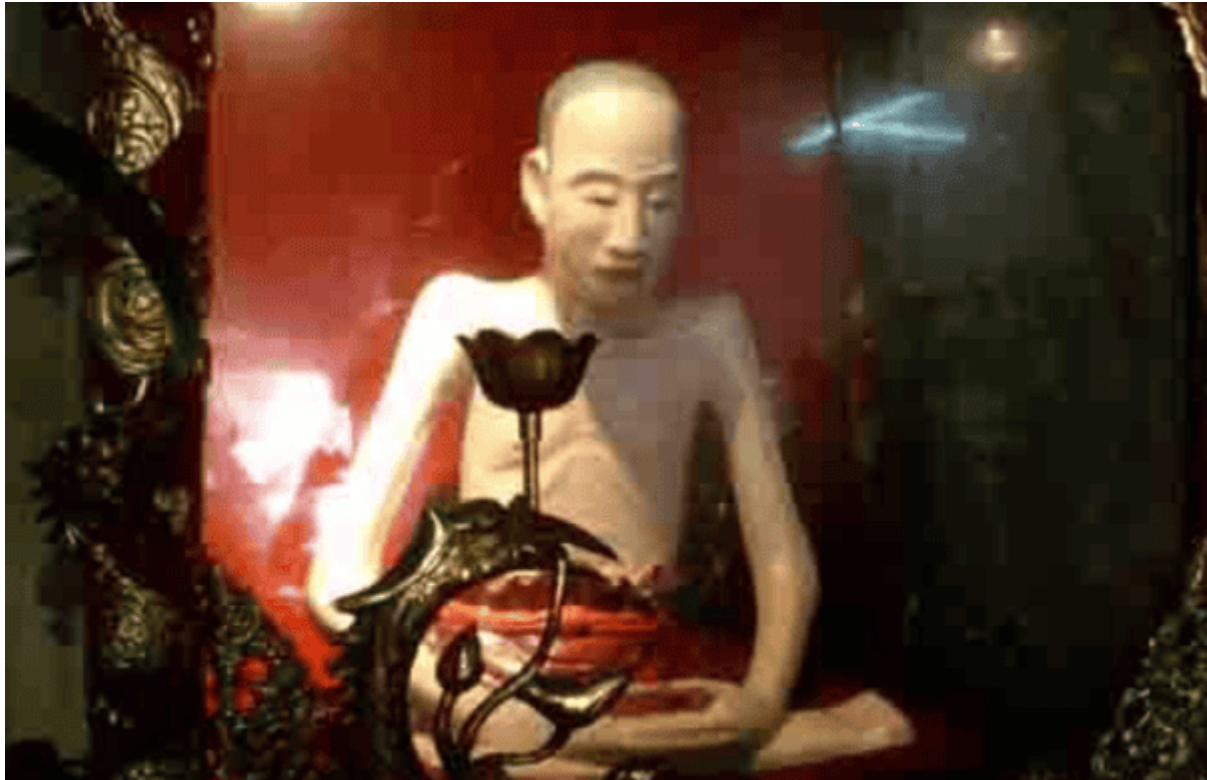
Nhục thân Thiền sư Đạo Tâm (tức Vũ Khắc Trường)

Các bậc cao tăng đắc đạo, thấu đạt ý nghĩa của đạo Phật đã dùng hình ảnh viên tịch để lại nhục thân của mình để chứng minh sự tu tập chứng đắc, chứng ngộ, để con người đời nay và đời sau có niềm tin vào ánh sáng của Phật pháp với triết lí vô vi (từ bi, hỉ xả), gieo nhân gặt quả, vượt lên trên hết là Tính Không của đạo Phật, giải thoát và giác ngộ.