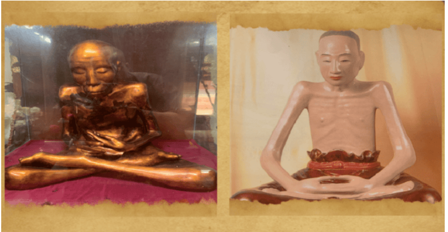
Nhục thân hai thiền sư tại chùa Đậu Ảnh: St

Chuyện kể rằng, khoảng thế kỉ XVII, vào một ngày nọ, thiền sư Vũ Khắc Minh (mà nhân dân trong vùng quen gọi ngài là cụ sư Rau - nhà sư thường chỉ ăn rau trừ bữa) bước vào trong am và nói với các đệ tử rằng: “Mang cho ta một chum nước uống và một chum dầu để thắp. Khi nào thấy dứt tiếng mõ hãy mở cửa am ra. Nếu thấy thi thể của ta đã hồng, thì dùng đất lấp am đi, còn ngược lại thì dùng sơn ta bả lên thi thể...”.