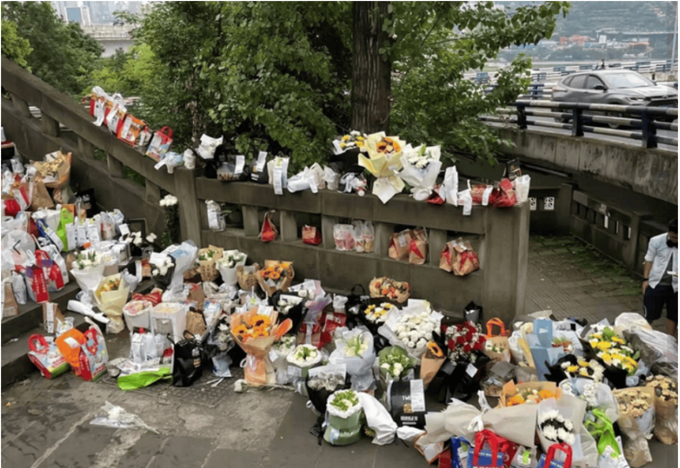
Cầu Thạch Bản Pha - Trùng Khánh, Trung Quốc

“Mèo Béo”, chàng trai người Trung Quốc tự tử vì thất tình ở độ tuổi 21 trở thành một hiện tượng hot trên mạng xã hội thời gian gần đây. Tràn lan các hình ảnh hàng loạt đồ ăn, đồ dung cá nhân được các nam nữ thanh niên Trung Quốc mang đến nơi chàng trai tự sát làm tắc nghẽn ảnh hưởng giao thông khu vực cầu Thạch Bản Pha sông Dương Tử ở Trùng Khánh, Trung Quốc để tưởng nhớ cậu, xót thương cho cậu vì câu chuyện tình yêu cảm động không được đền đáp.