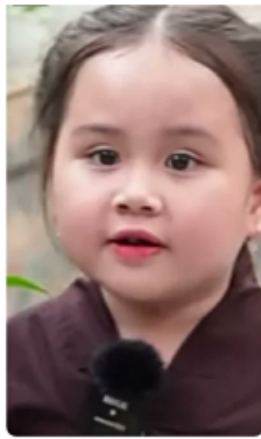
Bé Tường lam Nói kinh phật 8,9 N lượt xem