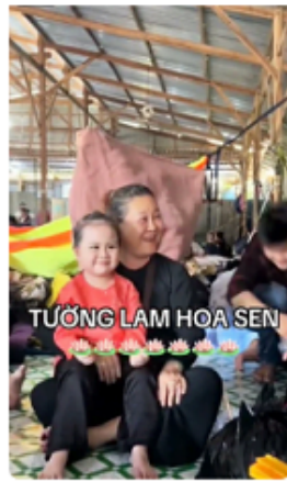
bé tường lam 4 tuổi làm náo động các đồng đạo thập... 2,5 N lượt xem