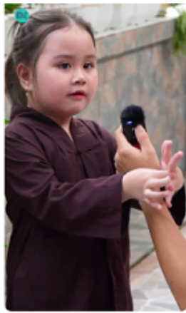
Phần 2: Bé 4 tuổi bồng dung ăn chay, thuộc lâu kinh kệ v... 777 N lượt xem