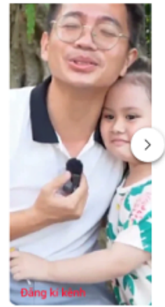
chấn động bé tường lam 4 tuổi nói lảm lảm phật pháp 31 N lượt xem