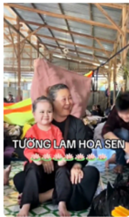
bé tường lam 4 tuổi làm náo động các đồng đạo thập... 2,5 N lượt xem