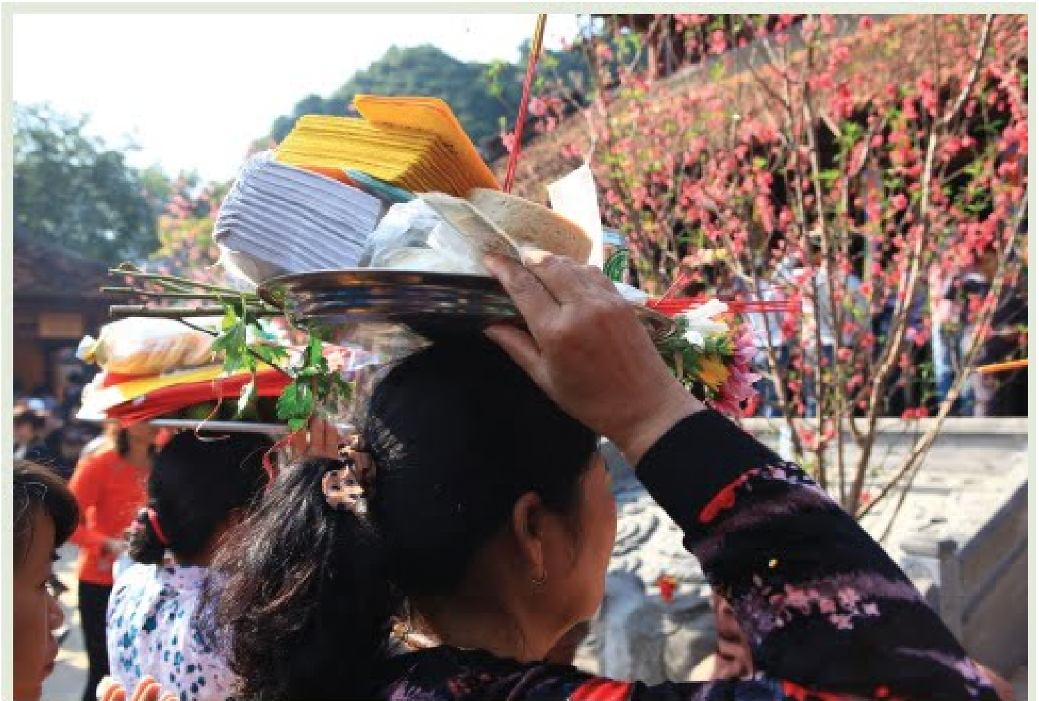
Dâng cúng vàng mã, đồ mặn lên chùa - Ảnh: Việt Thường