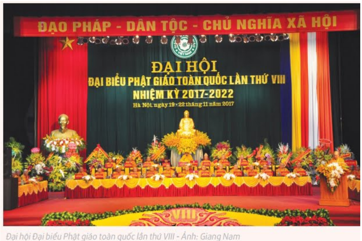
Đại hội Đại biểu Phật giáo toàn quốc lần thứ VIII - Ảnh: Giang Nam

Tư tưởng nhập thế Phật giáo đã góp phần xây dựng chuẩn mực đạo đức con người, đưa con người đến cuộc sống “chân - thiện - mỹ” , từ đó làm thay đổi tư duy phát triển kinh tế của nhiều doanh nghiệp tại Việt Nam.