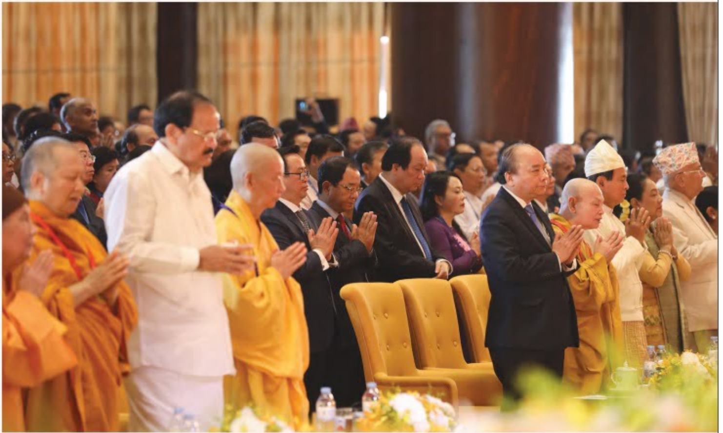
Đại lễ Phật đản LHQ Vesak 2019 tại chùa Tam Chúc (Hà Nam)

Chú trọng đào tạo tăng tài đáp ứng đủ số lượng, chất lượng phân bố đồng đều trên cả nước. Để thực hiện được nhiệm vụ chiến lược đó đòi hỏi Giáo hội Phật giáo Việt Nam cần có tầm nhìn, có kế sách bài bản, đào tạo và sử dụng khuyến tấn tăng, ni dẫn thân phụng sự đạo pháp; mặt khác phải dũng cảm gạt bỏ rào cản kỹ thuật, các tập quán cố hữu theo tư tưởng cục bộ để tăng, ni trẻ có cơ hội cống hiến, dẫn thân phụng sự đạo Pháp và dân tộc.