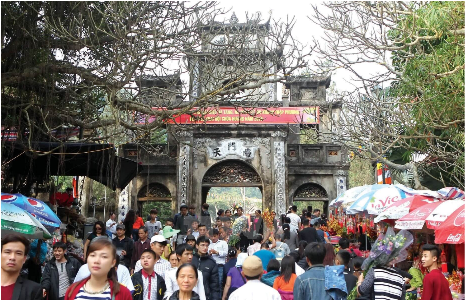
Đổi tiền lẻ có bằng “đổi tâm”? (Ảnh: Minh Khang)

Như vậy, một nước văn minh như Italy ở châu Âu cũng diễn ra việc rải hay tung tiền lẻ, nhưng ở hình thức này hay hình thức kia. Hình thức rải tiền lẻ diễn ra trên toàn cầu, không phân biệt quốc gia.