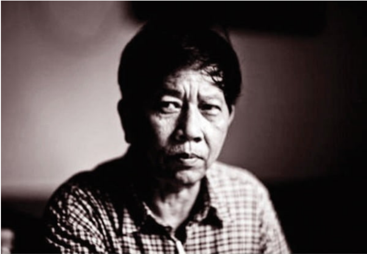
Cố nhà văn Nguyễn Huy Thiệp