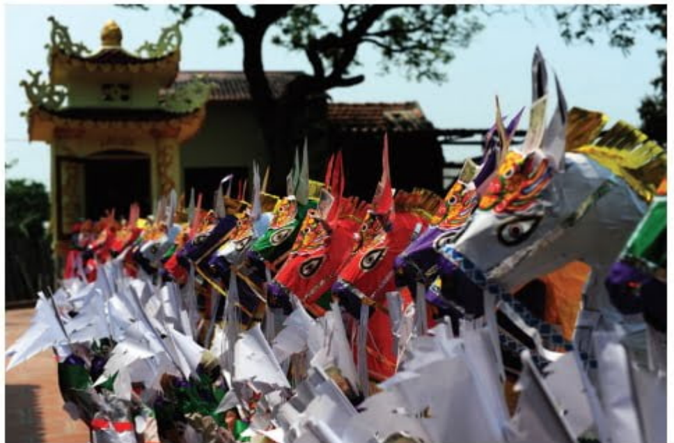
Vàng mã trong một lễ Dâng sao giải hạn đầu năm.