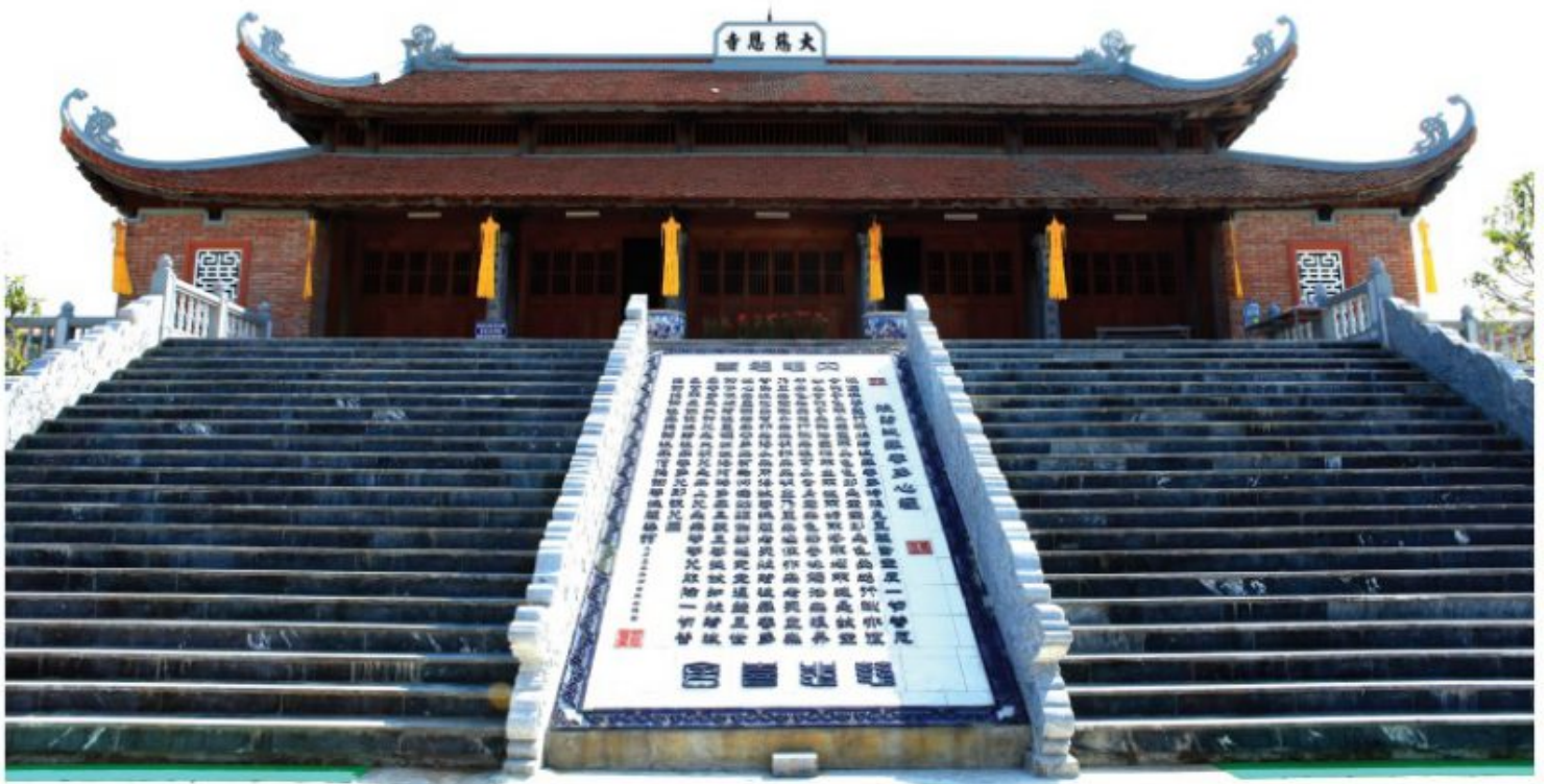
Phía giữa lối lên Tam Bảo với 21 bậc được trang trí bằng bản Bát Nhã Tâm Kinh

Toàn bộ chi phí xây dựng chùa do Công ty TNHH Đầu tư và Phát triển DIA - Hà Tây cũ, (nay là Công ty Cổ phần Đầu tư DIA) công đức với số tiền khoảng 120 tỷ đồng.