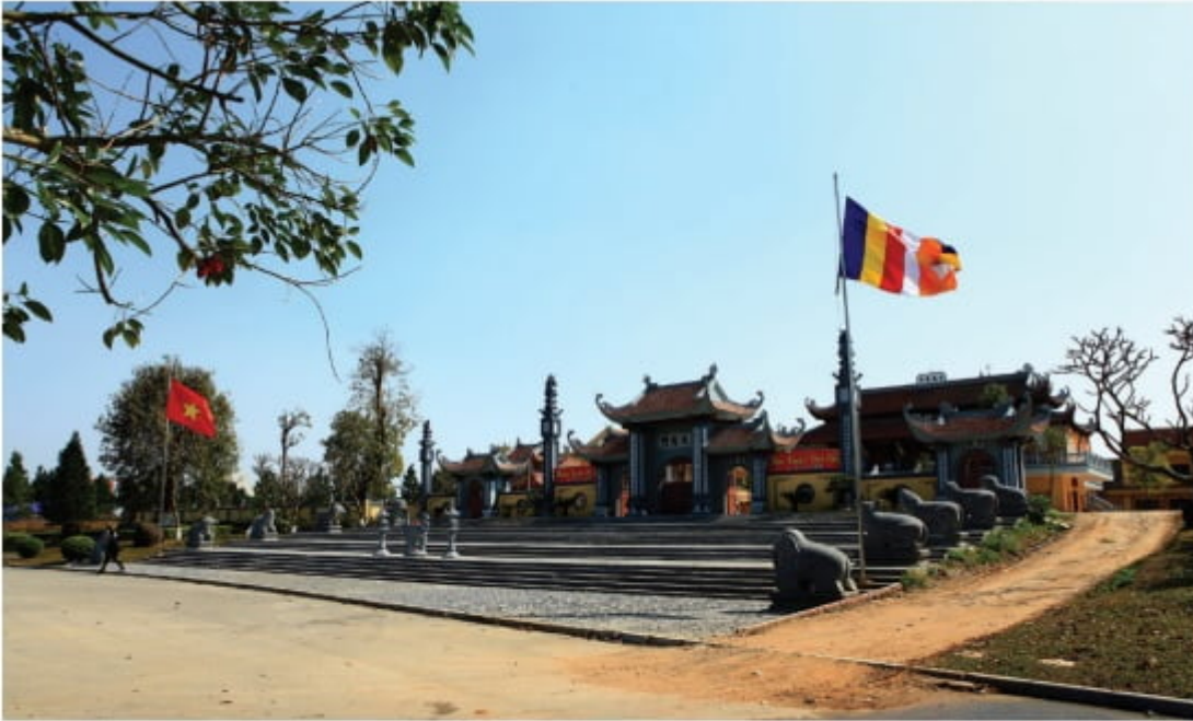
Trước cổng Tam Quan, với hàng 10 linh thú hai bên

Chùa Đại Từ Ân được khởi công xây dựng vào ngày 9/5/2010, với diện tích 19.275 m 2 mang phong cách kiến trúc thiết kế Bắc bộ được quy hoạch trọng điểm và tượng Phật A Di Đà cao 25m đặt giữa trung tâm tạo ra sự kết nối linh thiêng cho toàn khu đô thị.