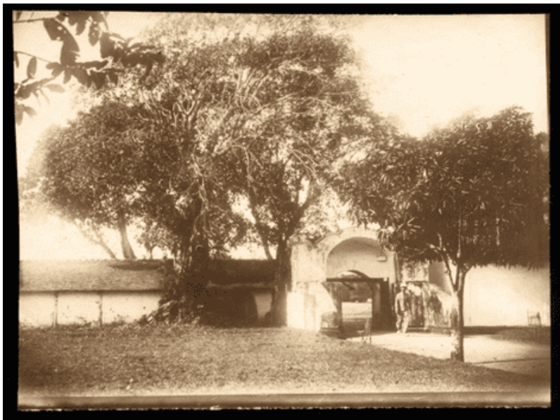
Cổng vào trại lính trên núi Pháo Đài Hà Tiên Vietnam COCHINCHINE