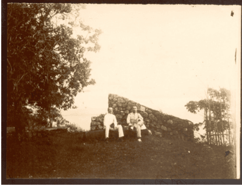
Hai người sĩ quan Pháp trên núi Pháo Đài Hà Tiên INDOCHINE Deux Officiers du 11e RIC au cap de Phao Dai Citrate

Nhiều nhà quyền thế cao sang cậy nhờ những ông mai bà mối kết nối những trái tim tới lui nườm nượp nhưng tất cả đều bị từ chối, cô chỉ nói đợi khi nào có đức Phật chỉ giáo thì mới kết nhân duyên phu thê với ai đó phải lòng. Song thân phụ mẫu không hiểu ý nhưng cũng miễn cưỡng chiều ý con gái yêu quý.