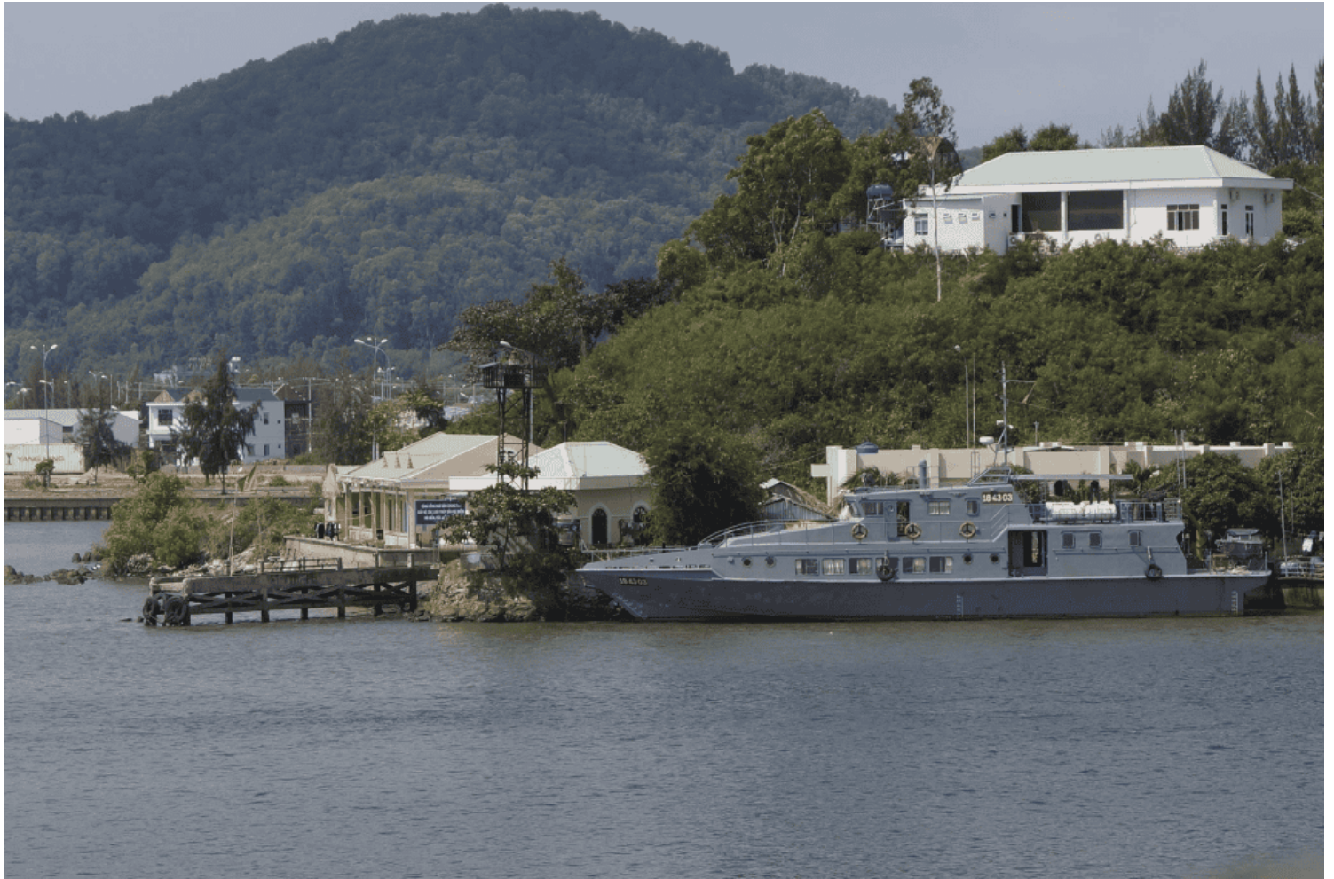
Cận ảnh Pháo Đài Hà Tiên ngày nay thời thanh bình