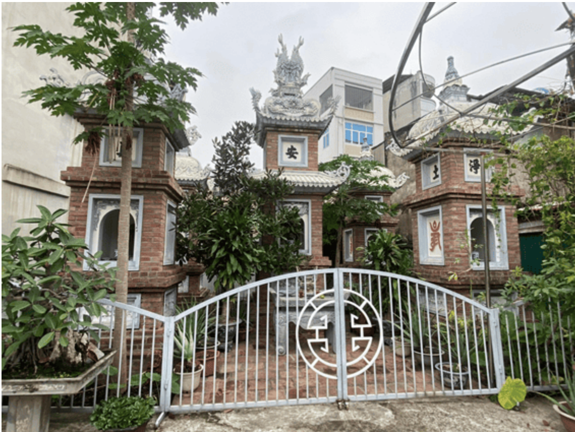
Vườn tháp tổ trong chùa

Mùng 9 là ngày chính hội. Ngay từ sáng sớm đã có nhiều người đến chùa mong cầu phúc, cầu tài, cầu bình an và cũng là để chọn một vị trí thích hợp để xem trận chung kết của giải cờ. Trận chung kết bắt đầu ngay sau lễ dâng hương của đông đảo các tầng lớp nhân dân ở khắp các địa phương.