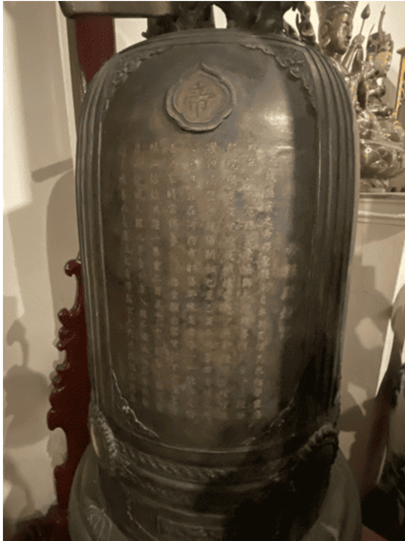
Chuông đồng trong điện Đế Thích