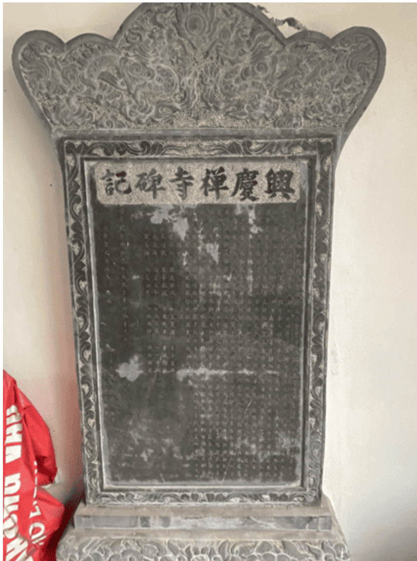
Bia Hưng Khánh thiên tự