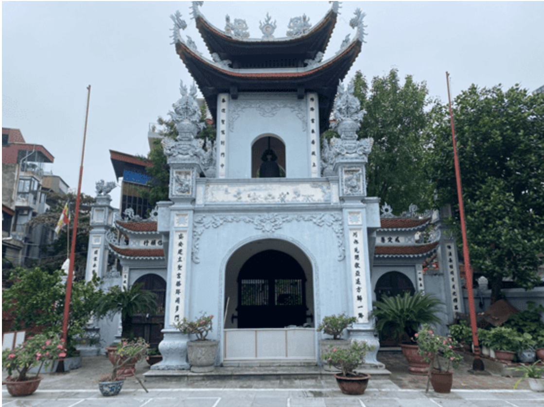
Tam quan chùa