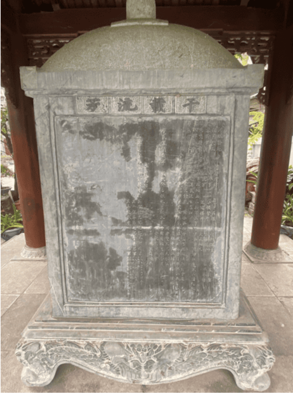
“Hà Thành thắng địa

Thịnh Yên phố phường Phạn vũ sáng khái Thánh điện huy hoàng Tự danh Hưng Khánh Điện viết Thiên vương Tứ thời phụng sự Thiền tắc hình hương Niên niên khai hội Tất cử kỳ trường Đoạt quán quân giả Danh tính lưu phương Viễn cận dương bá