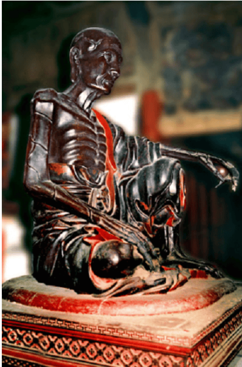
Tượng Tuyết Sơn

Tượng được tạc bằng gỗ mít sơn then đen nhánh. Pho tượng đẹp sinh động bởi tài năng điêu khắc của các nghệ sĩ dân gian, thể hiện được hình ảnh đức Phật tu khổ hạnh trong núi Tuyết Sơn. Với hơn hàng trăm pho tượng, các hoành phi, câu đối được bảo tồn, gìn giữ qua nhiều thế kỷ đã tạo nên giá trị tâm linh, cũng như giá trị lịch sử - văn hóa của chùa Trăm Gian.