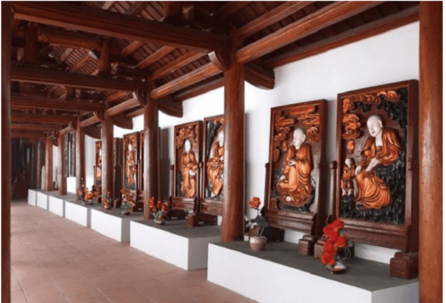
Phù điêu Thập Bát La Hán

Dọc gian tả và hữu hai lối lên Thượng điện chùa Trăm Gian là nơi phụng thờ các vị La Hán. Những bức phù điêu gỗ 18 vị La Hán tại chùa được chạm khắc tinh xảo. Đây là những bức phù điêu gỗ chạm nổi, mang phong cách tạo hình sáng tạo, đa dạng. Mỗi vị La Hán là một tác phẩm nghệ thuật độc đáo với những nét cách điệu, sinh động, hài hòa của nghệ thuật tạo hình thời Lê.