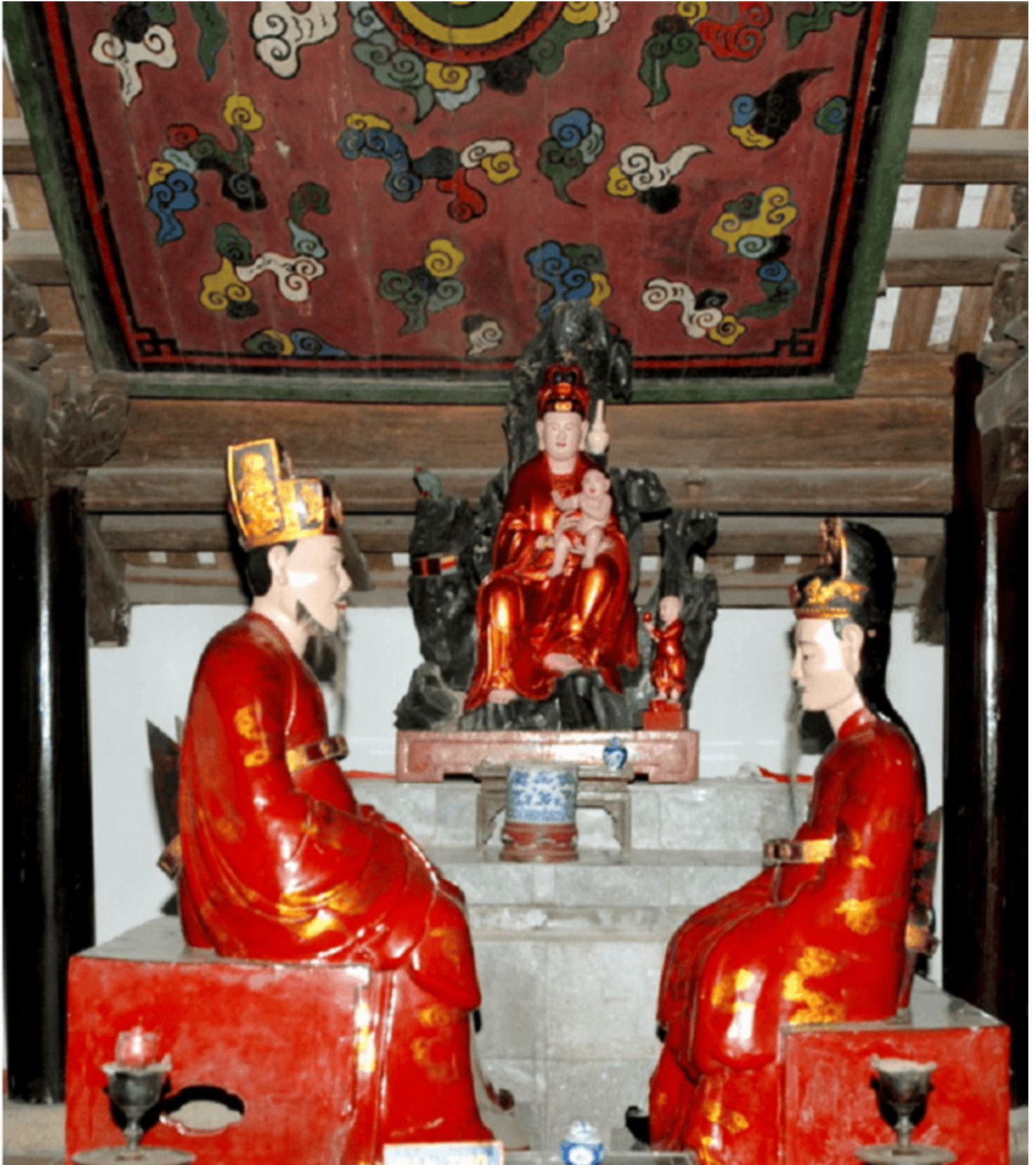
Tượng Quan Âm Tống Tử

Gian bên phải là khám thờ “đức Thánh Bối” Nguyễn Bình An, vị thánh đã được thờ ở chùa Bối Khê. Tượng thánh làm bằng mây đan ngoài bọc vải phủ sơn.