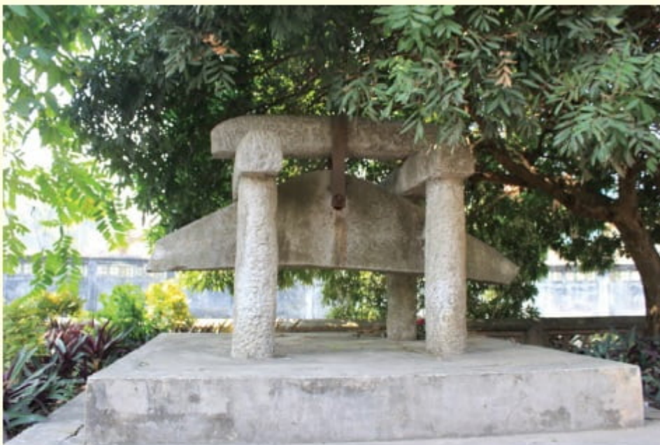
Khánh đá chùa Kiến Sơ

Ngôi chùa còn bảo lưu được hệ thống tượng Phật cổ phong phú, bài trí thành 7 lớp tượng. Lớp trên cùng bài trí Tam thế chư Phật có niên đại thế kỷ 17 làm bằng đất thó sơn son thiếp vàng. Sáu lớp thứ tự từ trên xuống dưới: hàng 1 là tượng A Di Đà, hàng 2 gồm năm pho tượng (tượng Di Lặc ở giữa), hàng thứ 3 là pho Quan Âm Nam Hải, Thích Ca niêm hoa tọa lạc ở hàng thứ tư, kế đến tượng Ngọc Hoàng, và dưới cùng có tòa Cửu Long.