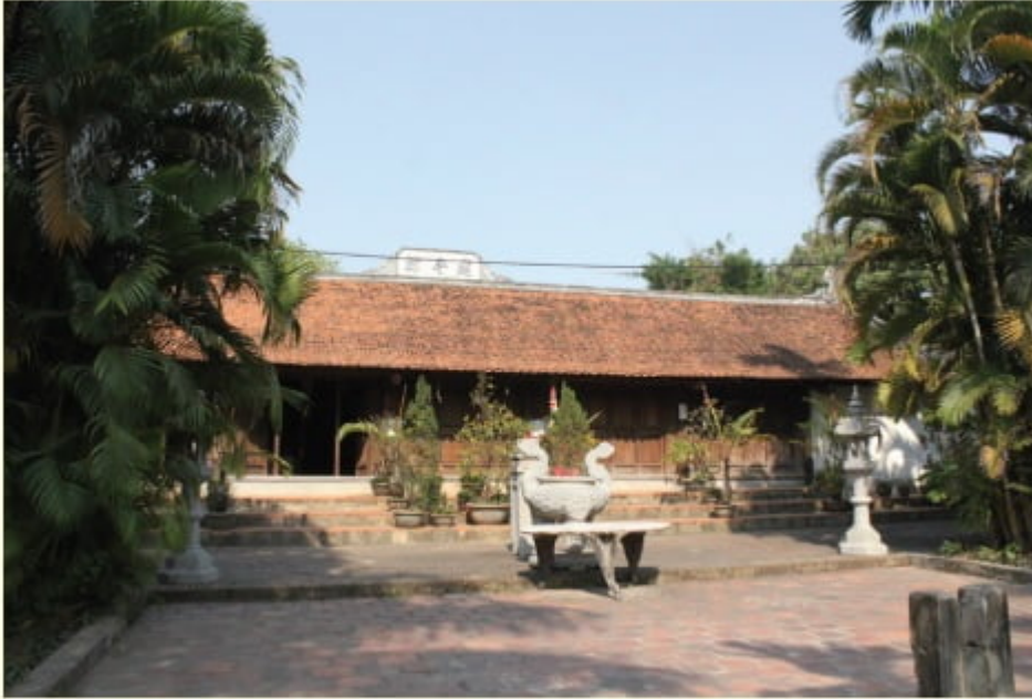
Chính điện chùa Kiến Sơ

Qua cổng Tam quan là ao sen, tạo khung cảnh hài hòa cho toàn bộ kiến trúc chùa cổ. Tổng thể ngôi chính điện trang nghiêm, bao gồm nhà thiêu hương, thượng điện và hậu Tổ, tạo nên kiến trúc kiểu nội công ngoại quốc như nhiều ngôi chùa cổ thường thấy ở Bắc bộ.