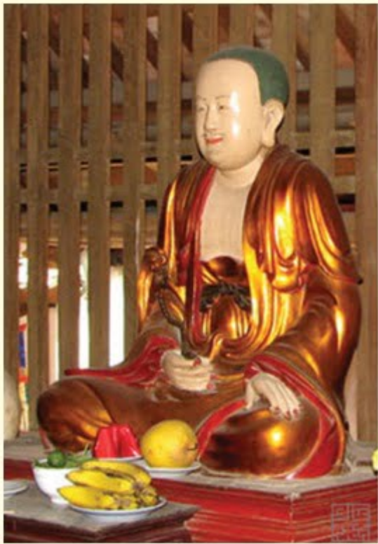
Tượng thiền sư Vô Ngôn Thông

Ngôi chùa còn bảo lưu được hệ thống tượng Phật cổ phong phú, bài trí thành 7 lớp tượng. Lớp trên cùng bài trí Tam thế chư Phật có niên đại thế kỷ 17 làm bằng đất thó sơn son thiếp vàng. Sáu lớp thứ tự từ trên xuống dưới: hàng 1 là tượng A Di Đà, hàng 2 gồm năm pho tượng (tượng Di Lặc ở giữa), hàng thứ 3 là pho Quan Âm Nam Hải, Thích Ca niêm hoa tọa lạc ở hàng thứ tư, kế đến tượng Ngọc Hoàng, và dưới cùng có tòa Cửu Long.