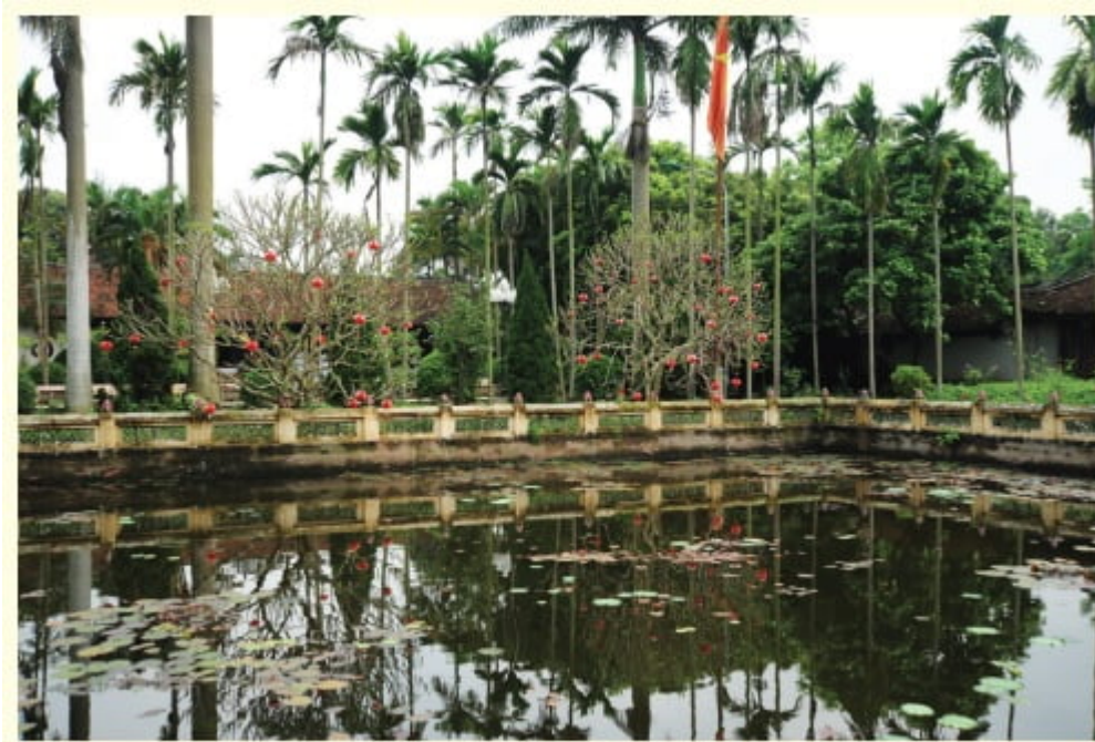
Ao sen