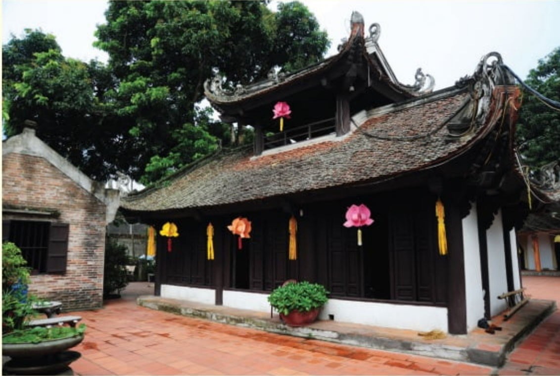
Tòa thiêu hương

Ngôi chùa là nơi lưu giữ nhiều truyền thuyết về vua Lý Công uẩn, vị vua khai sinh ra vương triều nhà Lý. Lý Công uẩn thuở còn nhỏ đã đến tu và học kinh Phật ở chùa này. Vì vậy sau khi Lý Công uẩn lên ngôi vua đã cho tu sửa mở mang chùa Kiến Sơ và đền Gióng.