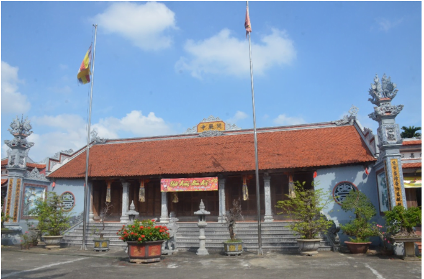
Tòa Tam bảo chùa Khai Nghiêm

Khởi công từ năm Quý Dậu (1333) niên hiệu Khai Hựu thứ năm, đến năm Ất Hợi (1335) niên hiệu Khai Hựu thứ bảy thì xong. Trong chùa điện Phật, phòng tăng đều theo kiểu cũ. Ngày làm lễ khánh thành, già trẻ trong cả một vùng đều chấp tay khen ngợi, tưởng như Công chúa Nguyệt Sinh sống lại...”