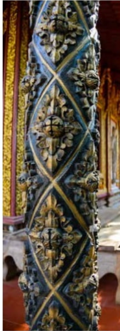
Hoa văn và màu sắc ở chùa