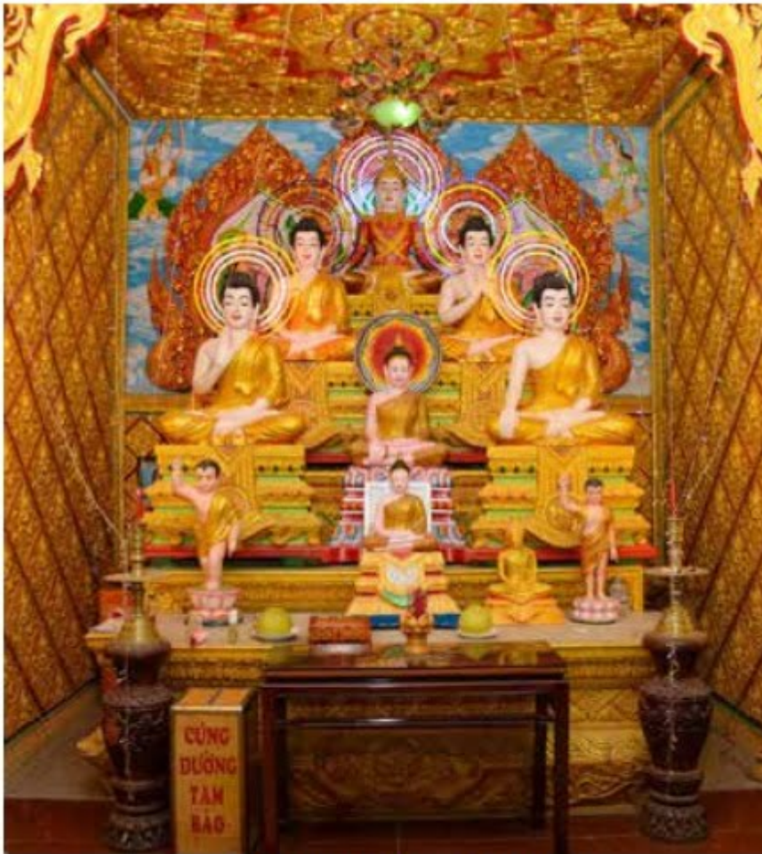
Bàn thờ Đức Phật trong sala tenne