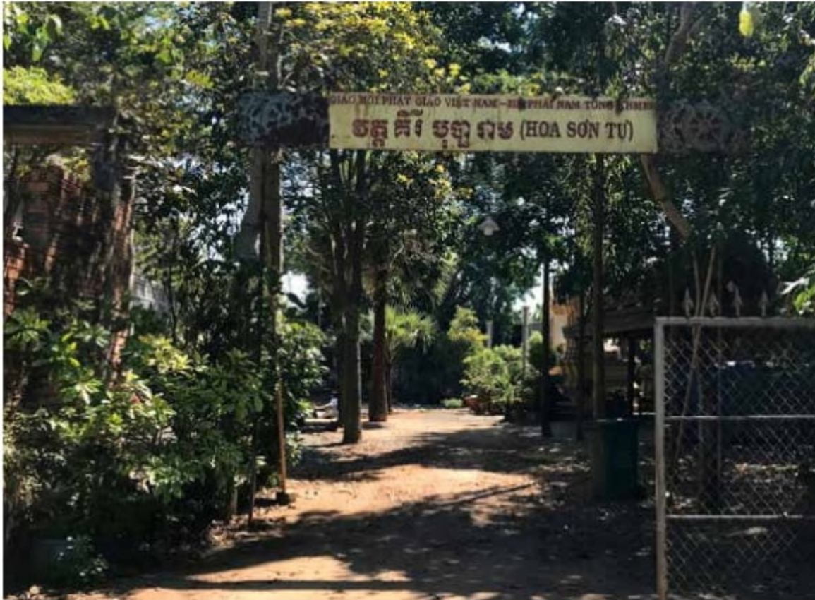
Cổng chùa Kiri Buppharam Ảnh: Thanh Thời - năm 2020

Bắt đầu xây dựng từ năm 1968 bởi đóng góp rất lớn từ cộng đồng người Khmer có quê quán từ Đồng bằng sông Cửu Long di cư đến sinh sống quanh vùng.