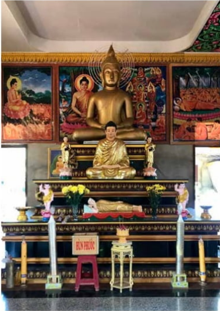
Bàn thờ Đức Phật trong chánh điện