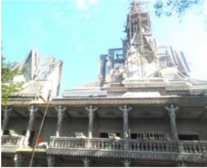
Tòa tháp tầng xá năm 2020