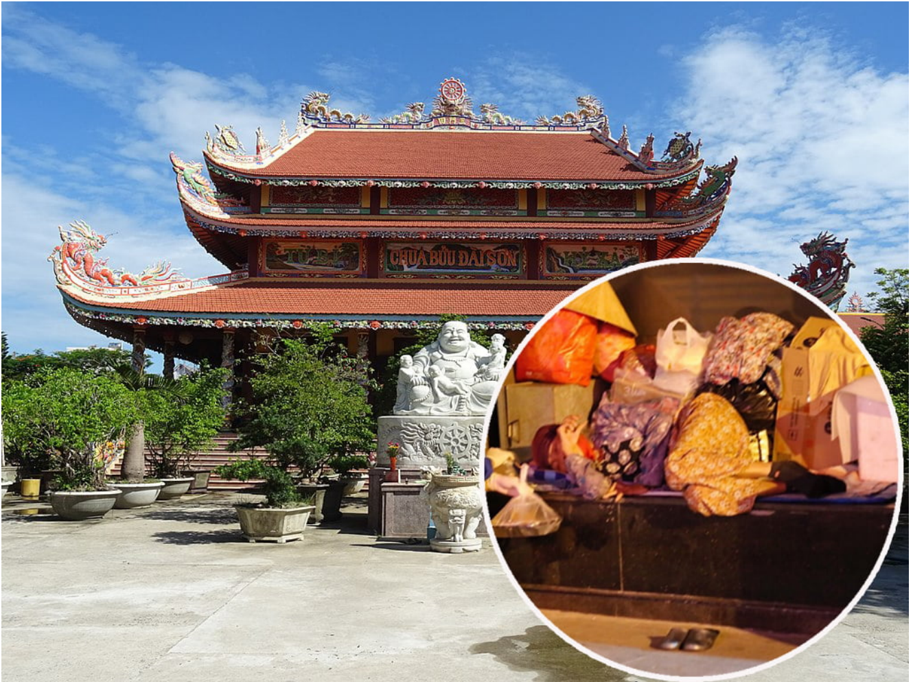
Hình ảnh chỉ mang tính chất minh họa.

Ví dụ như ở Mỹ, các ngôi nhà luôn có khoảng sân cách biệt với đường đi bên ngoài, ở Hàn Quốc thì người dân đa số sống ở các nhà cao tầng...nên các Sư cảm thấy việc khất thực ở các quốc gia đó sẽ không phù hợp nên họ tự xóa bỏ pháp tu của mình chứ chính phủ nơi sở tại không ngăn cấm họ trong việc đi khất thực. Việc khất thực cũng giống như các nội dung thuyết pháp của các Sư, tùy vào thời cuộc, tùy vào đối tượng để thay đổi cách giảng cho phù hợp chứ không ai ra văn bản bắt Sư này, Thầy kia phải giảng theo cách này mà không được giảng theo cách khác.