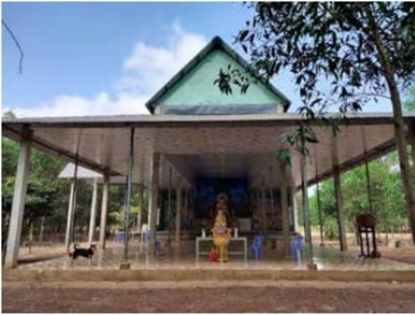
Chánh điện chùa năm 2020