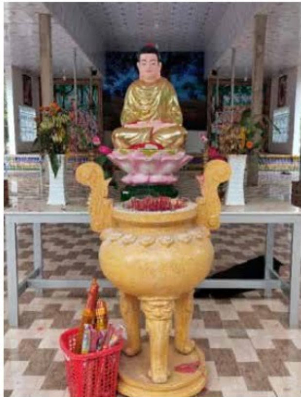
Tượng Đức Phật trong chùa Chà Là - năm 2020