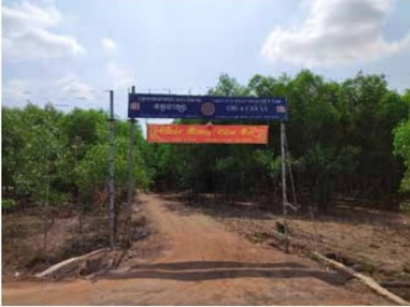
Cổng vào chùa Chà Là Ảnh: Phan Anh Tú - năm 2020