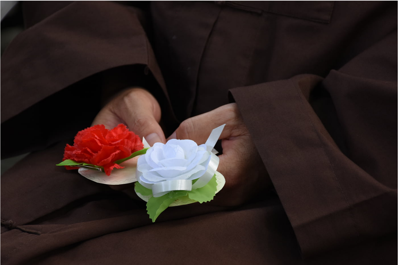
Tháng 7 năm nay mọi thứ thật khác...

Hiếu Tâm là phương thức sau cùng: Có nghĩa là khi chúng ta vì hoàn cảnh hay vì một nguyên do gì đó mà phải sống xa quê hương, xa cách cha mẹ, nhưng tâm tư của chúng ta vẫn luôn luôn hướng về cha mẹ, không khi nào quên những gì cha mẹ từng chỉ dạy khi còn ở gần. Những ý tưởng như vậy gọi là hiếu tâm.