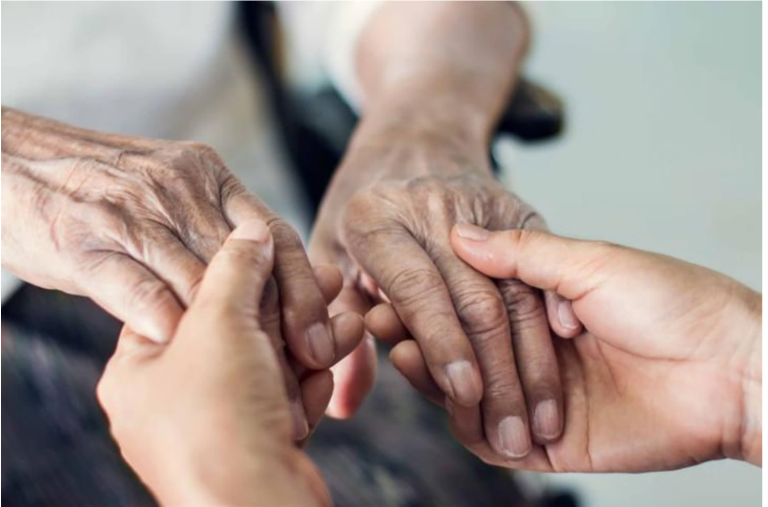
Chữ Hiếu trong những ngày đại dịch.

"Công cha như núi Thái Sơn Nghĩa mẹ như nước trong nguồn chảy ra. Một lòng thờ mẹ kính cha, Cho trọn chữ hiếu mới là đạo con"