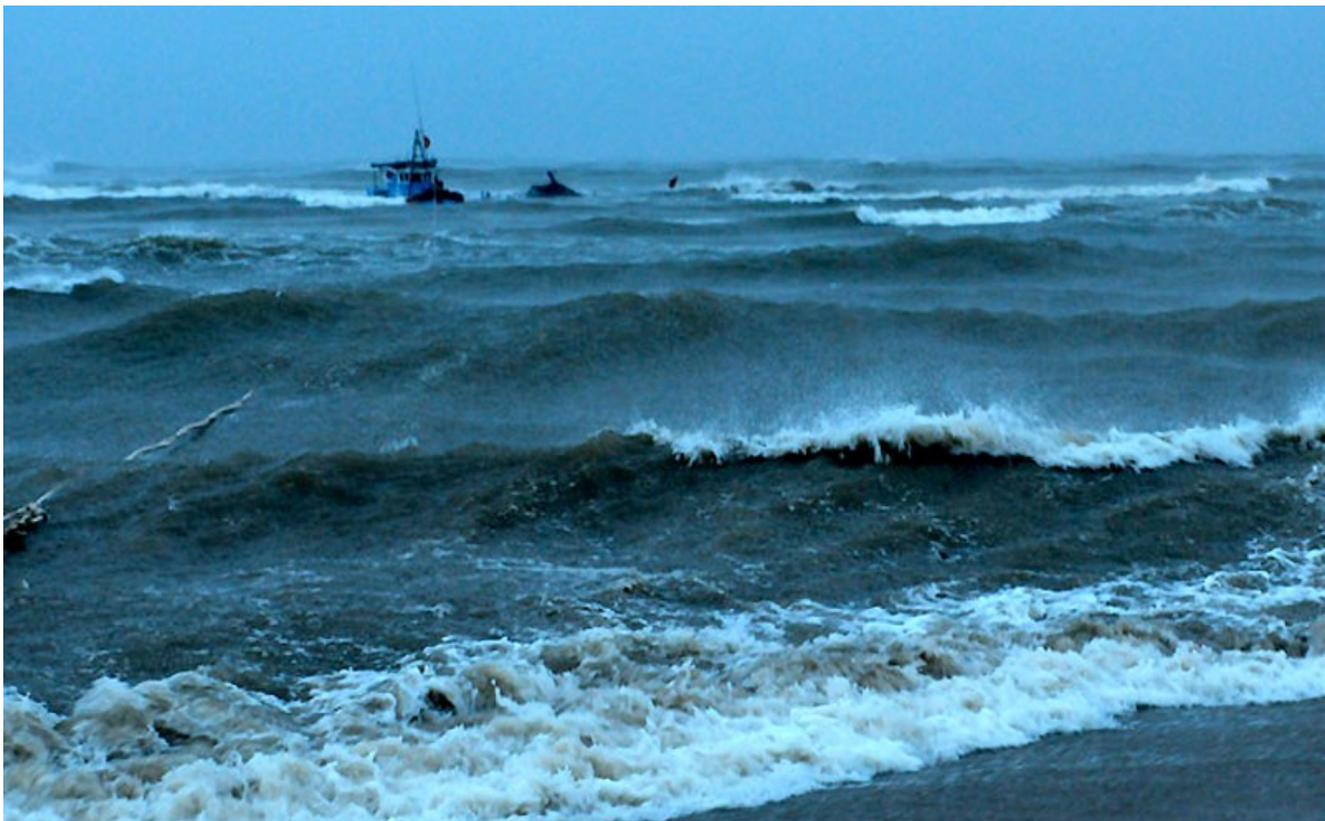
Hình ảnh chỉ mang tính chất minh họa.

Anh phụ lái chạy tới chạy lui thả tấm che mưa và liên tục múc nước tạt ra ngoài. Trẻ con trên tàu vừa khóc, vừa nôn mửa, tôi chỉ biết ôm hai đứa con, che chắn cho chúng khỏi lạnh. Chỉ có một người vẫn bình tĩnh từ lúc biển động đấy là bác tài công. Bác ấy trấn an, khuyên chúng tôi bình tĩnh và cùng phối hợp với anh phụ lái điều khiển thuyền. Tôi nghe loáng thoáng hai người nói với nhau là thả neo, nhưng không hiểu sao vài lần mà vẫn chưa được. Cảm giác bác tài công bắt đầu quỳnh quáng khi thuyền rung lắc mạnh, hết nghiêng bên này, nghiêng bên kia, đồ đạc và người trên thuyền cũng dạt về theo hướng nghiêng của thuyền, có người mất thăng bằng loạng choạng té ngã. Tôi bắt đầu chỉ biết cầu khẩn trời phật, miệng lầm rầm những câu Nam mô!.