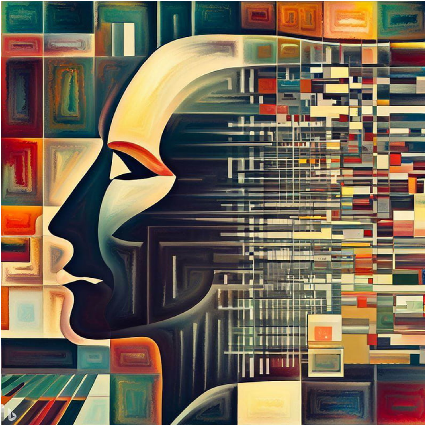
Sự phân biệt trong thời đại hậu sự thật. Được tạo bởi BingAI