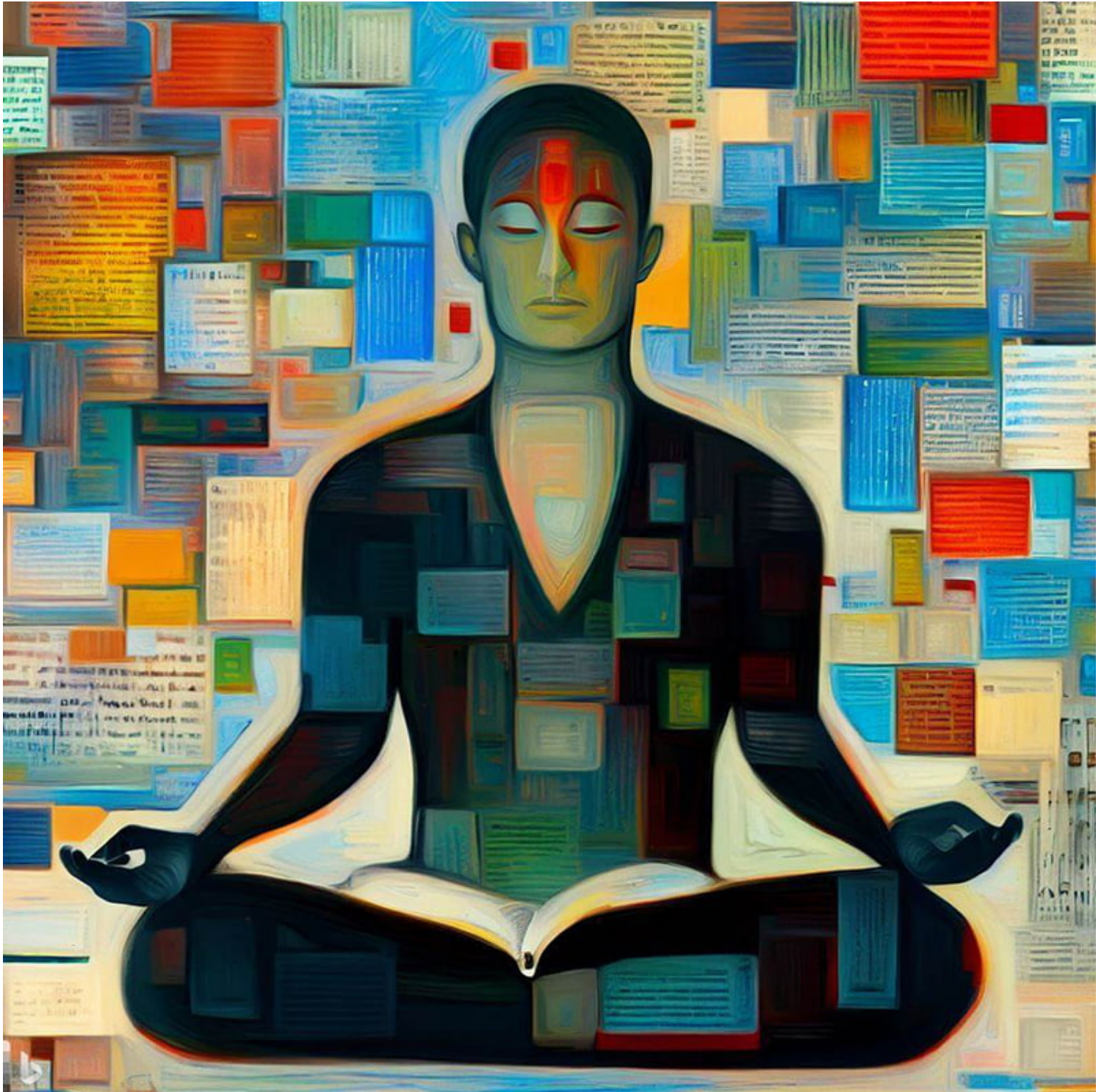
Tích hợp thông tin ổn định . Được tạo bởi BingAI.