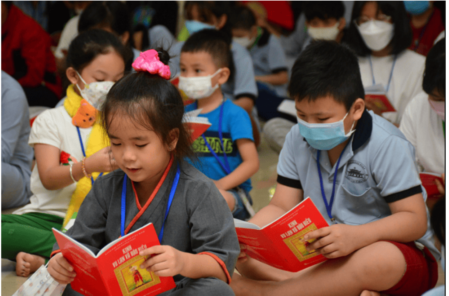
Hình ảnh chỉ mang tính chất minh họa.

Đem cái tình cảnh học Phật của mình điều tàn nhường ấy, mà so sánh với nền học thế gian, hùng vĩ nhường kia, nên chúng tôi bảo đệ tử nhà Phật ngày nay đã thất học ngay từ khi mới vỡ lòng, tưởng cũng không phải là quá đáng.