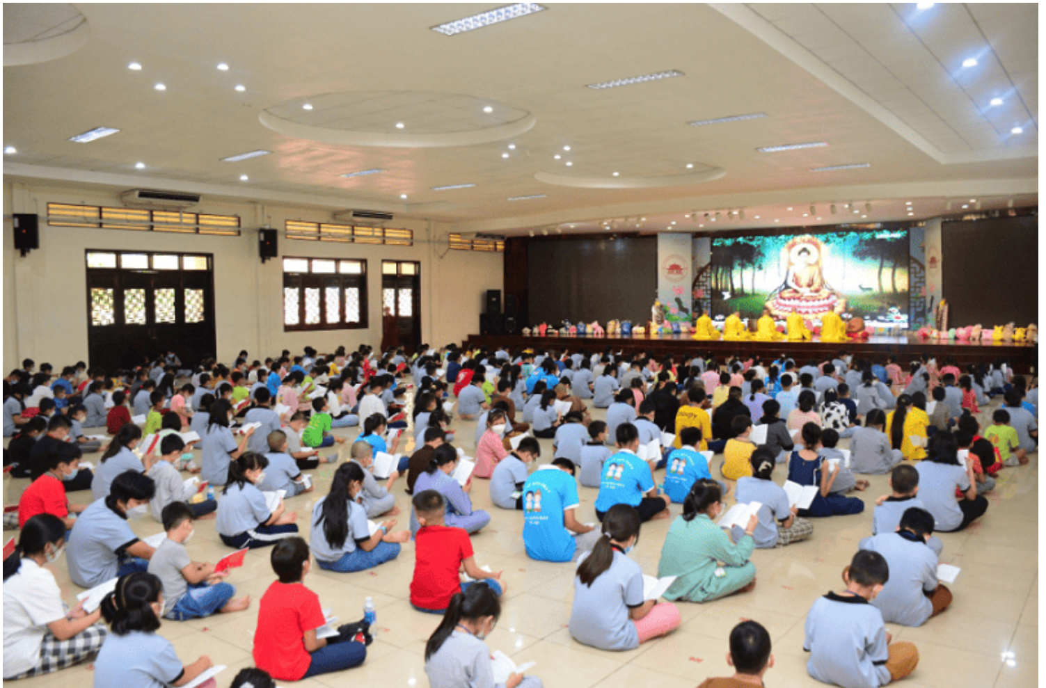
Hình ảnh chỉ mang tính chất minh họa.

Chính ngay cái thân chúng tôi đây cũng chỉ vì đã tiêm nhiễm lời nói ấy mà từ lúc trẻ thơ đến bạc đầu, vẫn chẳng hiểu đạo là chi, thế mà vẫn tự hào là một đệ tử của Phật. Vẫn tưởng rằng đạo Phật là huyền bí lắm, sức người phàm trần không thể học nổi, phải có Phật, Thánh hiện hình ra chỉ bảo cho thì mới hiểu được.