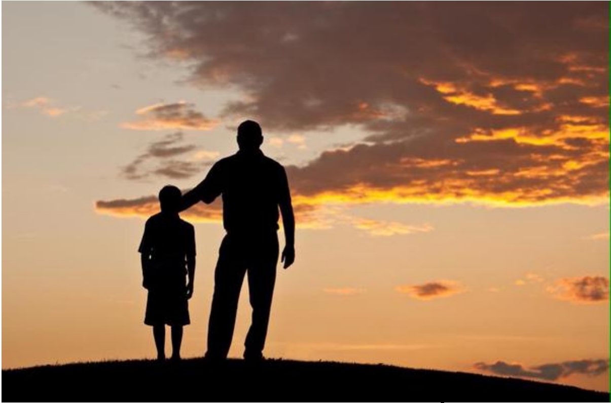
Hình ảnh chỉ mang tính chất minh họa.

Nhớ lại kỉ niệm, năm học cấp 1, tôi bị cô giáo la trốn học bỏ về nhà, rồi bị cha đánh đòn bằng cây roi bông búp, nỗi đau ấy thấm vào da, in lằn dấu trên da thịt để lại cả tuần, con đã khóc rất nhiều. Khi đó, con đâu biết, ba thương con, mong con trở thành người hiền đức.