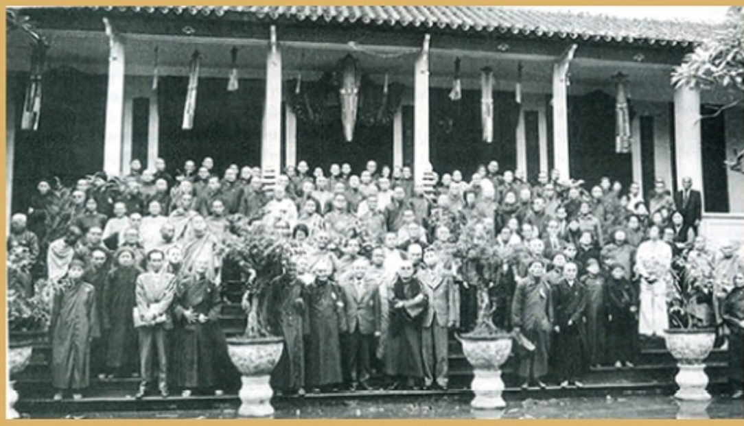
Các đại biểu dự Đại hội thống nhất Phật giáo Việt Nam chụp hình trước điện thờ chùa Quán Sứ - Trụ sở Trung ương Giáo hội