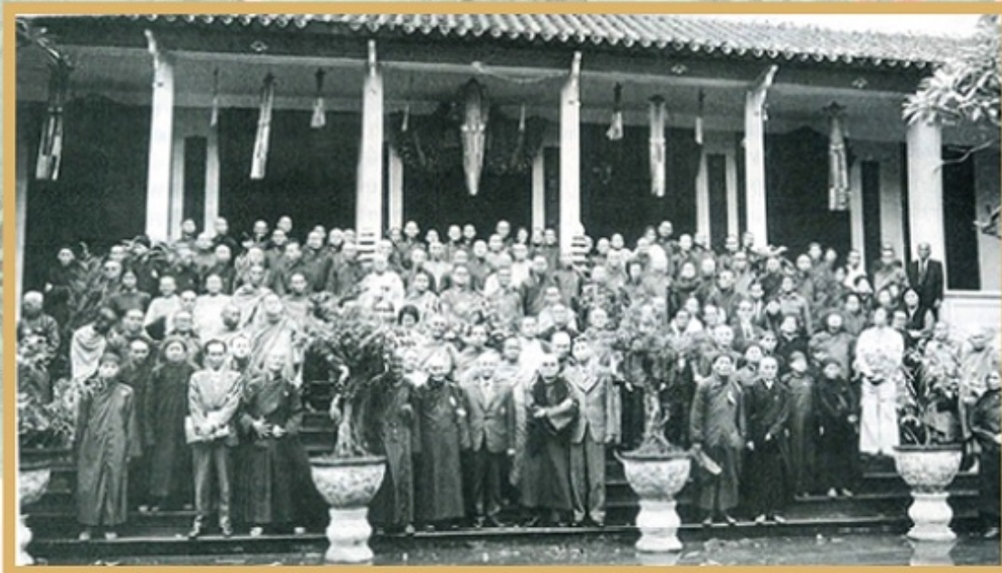
Các đại biểu dự Đại hội thống nhất Phật giáo Việt Nam chụp hình trước chính điện chùa Quán Sứ - Trụ sở Trung ương Giáo hội