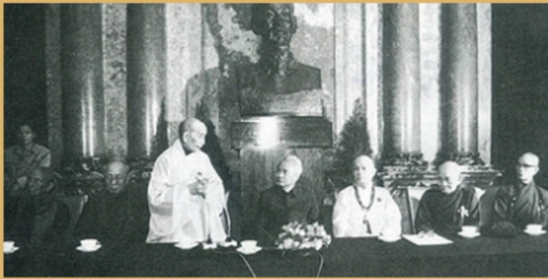
Hòa thượng Thích Đức Nhuận - Đệ nhất Pháp chủ GHPGVN trong buổi tiếp của Chủ tịch Hội đồng Bộ trưởng Phạm Văn Đồng