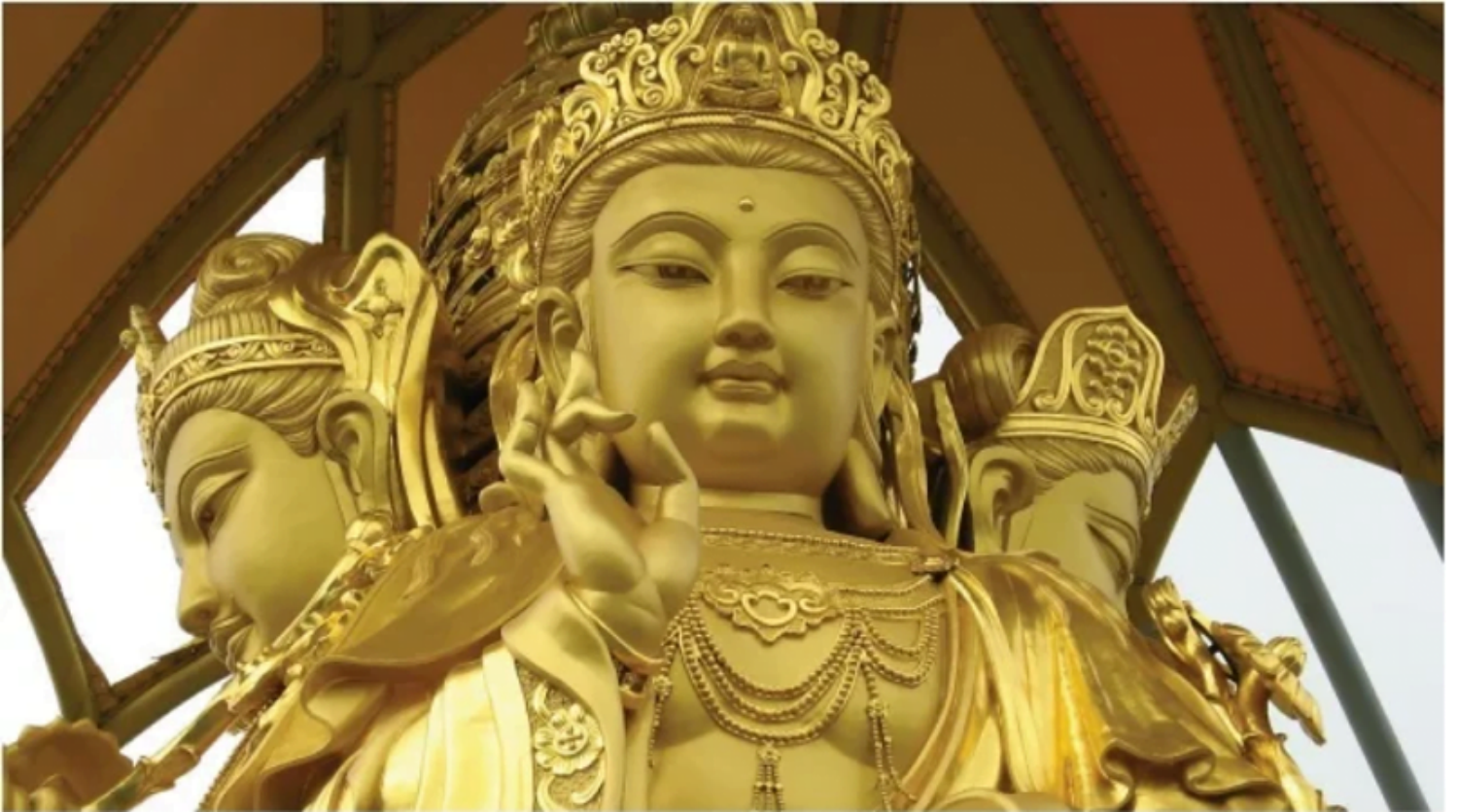
Hình ảnh chỉ mang tính chất minh họa.

Bồ tát Thường Bất Khinh dù không phải người hiểu biết như thế gian định nghĩa, nhưng mang ý tóm thâu về tính sáng suốt. Như vậy, vạn pháp, nghìn phương đều quy về thiện, đánh thức năng lực vô hạn của chúng sinh, chỉ ra Phật tính chính là thiện sư. Thầy cô giáo, thế gian kính ngưỡng, cúi đầu nhớ ơn là những người dạy dỗ, dung dưỡng nên nhân cách con người trên nền tảng đạo đức nhưng còn trong tam giới, luân hồi.