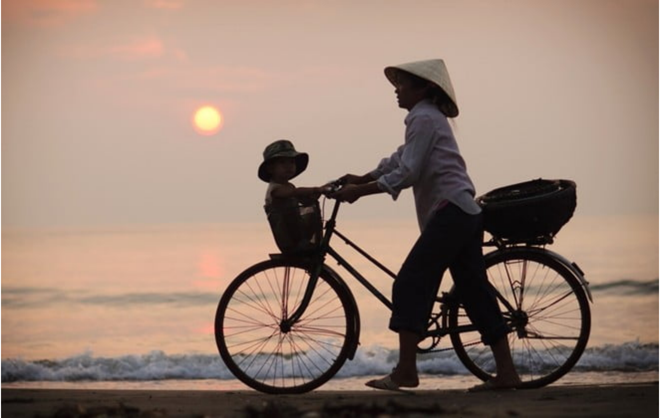
Hình ảnh chỉ mang tính chất minh họa.

tặng bánh mì cho họ ăn, gặp sinh viên khó khăn thì mẹ cho tiền để mua sách vở, thậm chí sinh viên không có chỗ ở liền đem về chăm sóc như con và chu cấp cho đi học, hàng xóm láng giềng ai khốn khó mẹ tôi đều giúp đỡ bằng khả năng của mình có được. Chính vì vậy, mẹ tôi là bà mẹ khá đặc biệt, ngoài con ruột là anh em tôi bà còn có rất nhiều con nuôi.