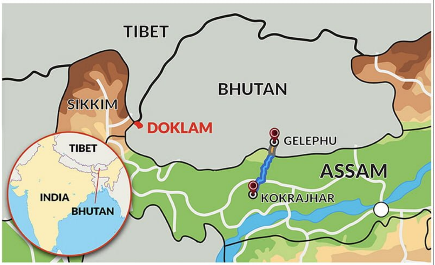
Tuyến đường sắt Kokrajhar-Gelephu

Trải rộng trên diện tích 1.000 km 2 , tương đương 250.000 mẫu Anh, Khu hành chính đặc biệt Gelephu (SAR) sẽ liên kết Bhutan với Assam, bang nằm ở vùng Đông Bắc Ấn Độ để thúc đẩy hội nhập khu vực và tiểu khu vực.