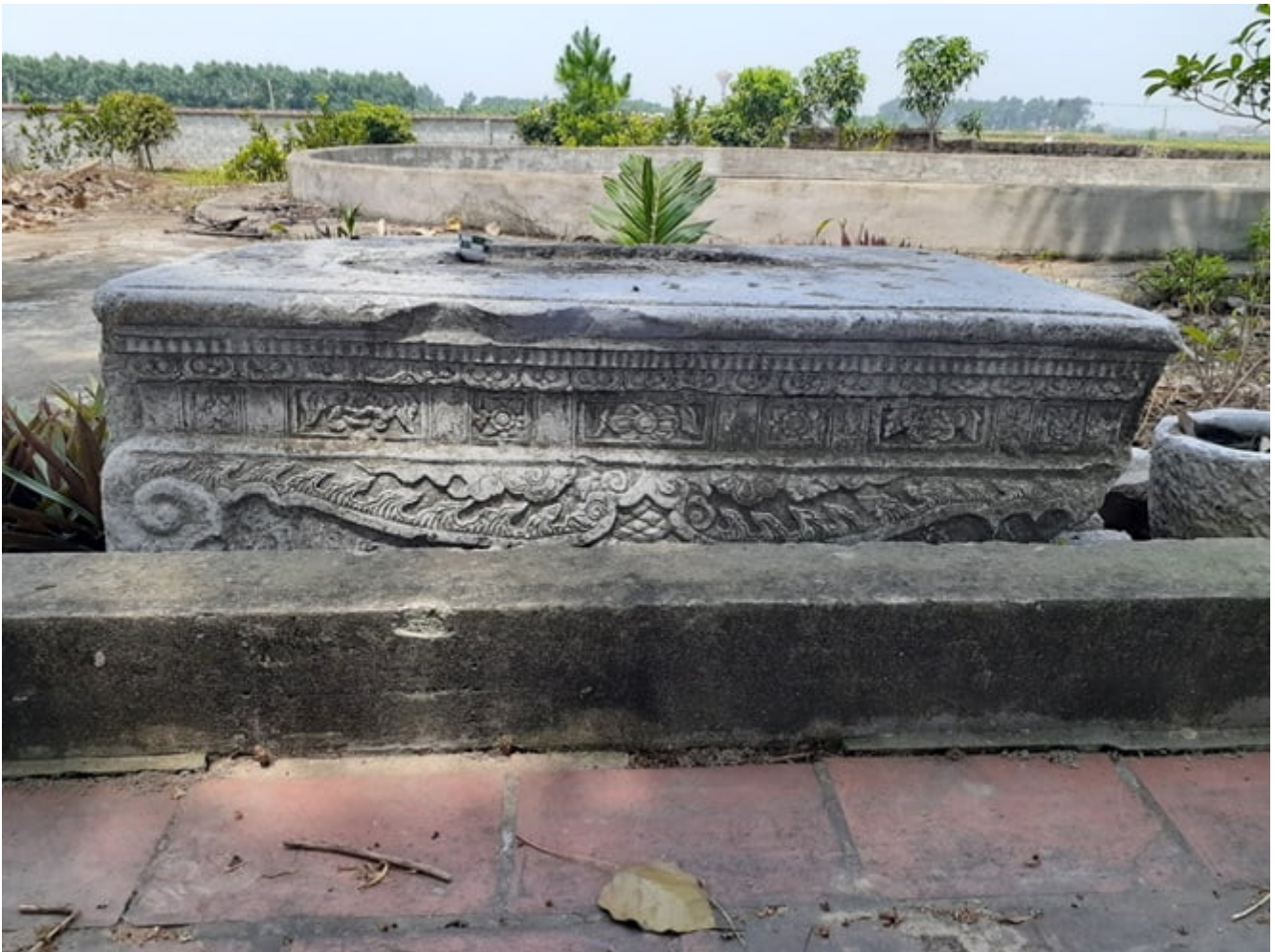
Bệ thờ đá ở chùa làng Thanh Khê niên đại thế kỷ XVII.

Chùa làng Thanh Khê còn có tên chữ là “Vĩnh Phúc thiên tự” được khởi dựng từ lâu đời, trùng tu mở rộng quy mô lớn dưới thời Lê Trung Hưng (thế kỷ XVII - XVIII). Cùng với đình làng, ngôi chùa cổ bị phá hủy hoàn toàn trong kháng chiến chống thực dân Pháp vào năm 1949. Đến năm Bính Tý (1996) dân làng xây dựng lại chùa mới trên nền xưa đất cũ. Hiện nay tòa Tam bảo chùa làng Thanh Khê có mặt bằng tổng thể kiểu chữ Đinh (丁) gồm 3 gian Tiền đường, 1 gian Thượng điện, kết cấu kiến trúc đơn giản, các bộ vì kèo đều được bào trơn đóng bén không trang trí chạm khắc.