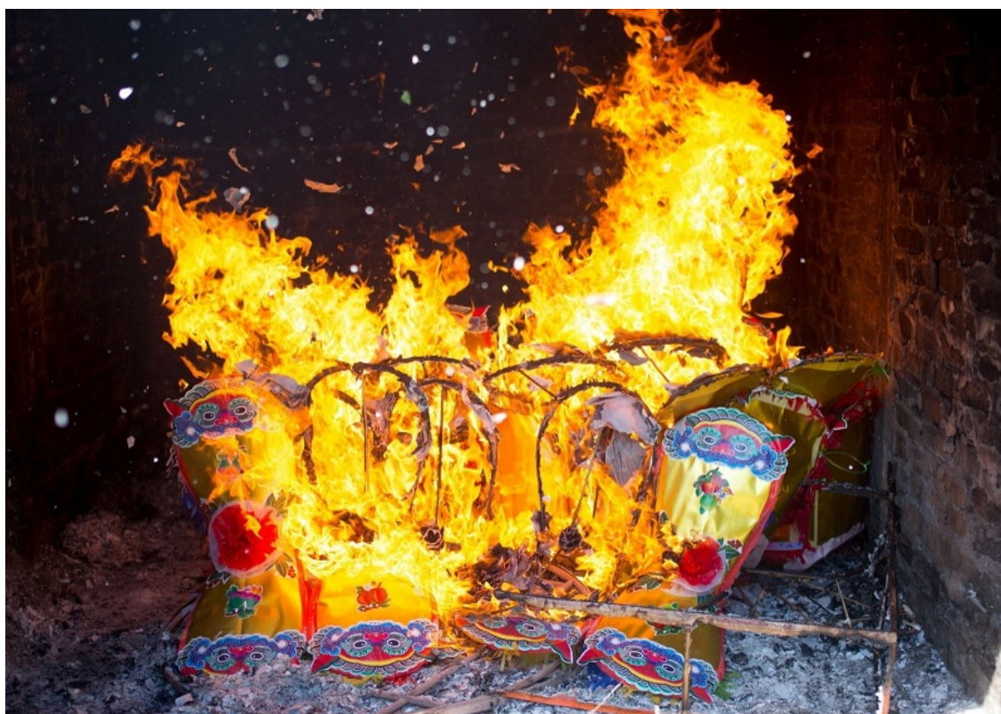
Hình mang tính minh họa

Các nghiên cứu về sự hòa nhập giữa Phật giáo và tín ngưỡng dân gian, chủ yếu được tìm thấy trong các tác phẩm nghiên cứu về phong tục Việt Nam. Một số tác giả đã chỉ ra rằng, người Việt đã kết hợp các yếu tố của Phật giáo (như lễ cầu siêu, tụng kinh...) với các phong tục truyền thống (như đốt vàng mã) trong các nghi lễ thờ cúng.