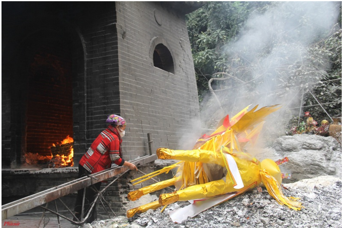
Hình mang tính minh họa (ảnh: Intertnet)

Tuy nhiên, trong các tư liệu lịch sử Việt Nam, tục đốt vàng mã phổ biến hơn từ thời Lý - Trần (thế kỷ XI - XIV), khi Nho giáo dần có ảnh hưởng mạnh mẽ đến đời sống văn hóa và tín ngưỡng dân gian. Dưới thời Lê, đặc biệt là thời Hậu Lê (thế kỷ XV - XVIII), tục lệ này được duy trì trong các nghi lễ cung đình và dân gian.