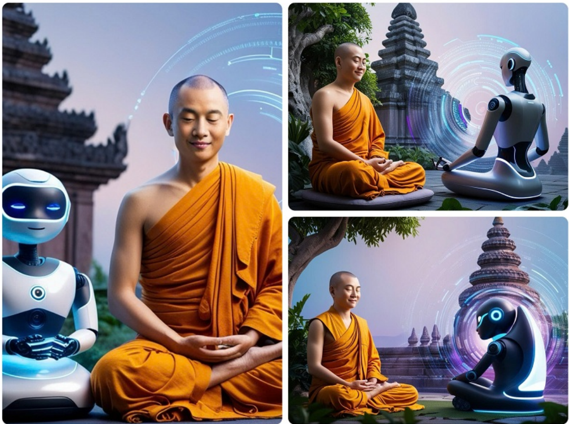
Hình ảnh được tạo bởi công nghệ AI.

Nếu AI lan truyền những thông tin tiêu cực, liệu con người có thể tận dụng điều đó để quán chiếu về khổ đau, từ đó hướng đến sự tỉnh thức và giác ngộ không?