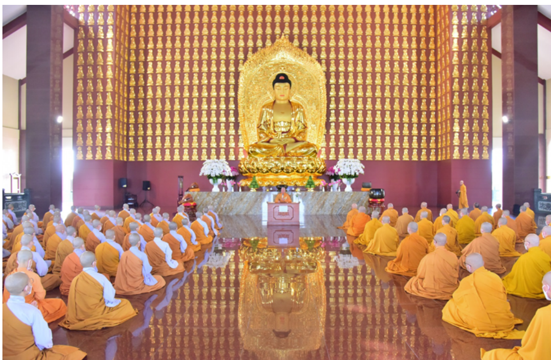
Hình ảnh chỉ mang tính chất minh họa (sưu tầm)

Theo tôi, đây cũng chính là nền tảng đầu tiên mà các bậc cổ đức muốn xây dựng nơi người học đạo. Trước khi nói đến việc nhiếp chúng hay gánh vác Phật sự, mỗi người cần có một điểm tựa vững chắc trong chính mình. Điểm tựa ấy không nằm ở chức vụ, học vị hay khả năng của mỗi người, mà nằm ở lý tưởng xuất gia và tâm nguyện phụng sự đã được nuôi dưỡng từ những ngày đầu bước vào cửa đạo.