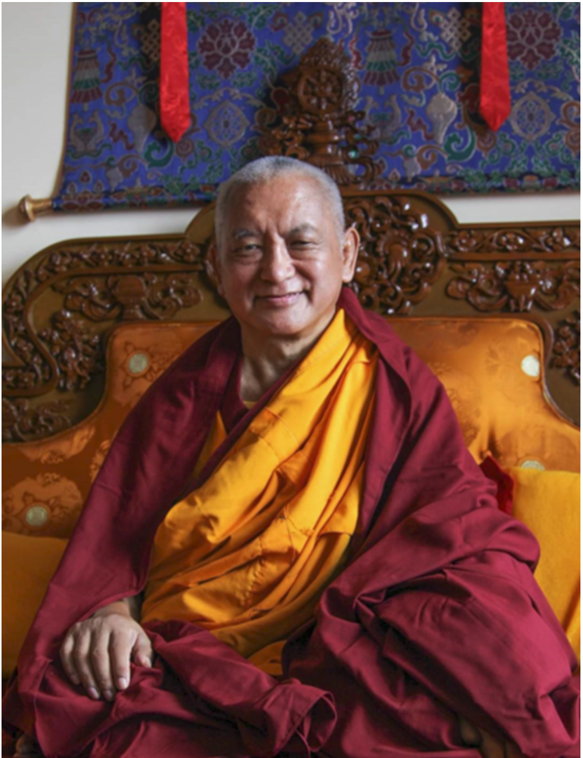
Ảnh sư tâm

Khi bậc Thầy đưa ra lời khuyên dạy, thì có nghĩa đó là hiện thân lời của tất cả chư Phật, và khi bậc Thầy truyền trao giáo pháp thì đó là hiện thân “ thiện hạnh của tất cả chư Phật ” chư Phật. Người đệ tử phải luôn luôn suy nghĩ theo cách đó và tôn kính bậc Thầy theo cách đó. Khi ấy, không chỉ bậc Thầy mà mỗi hạt bụi trên thân linh thiêng, thậm chí “ một đầu lông, đều hiện vô số chư Phật ”. Khi phụng sự các bậc Thầy với trí tuệ như vậy, thì đó là phụng sự bất khả tư nghì và sự tịnh hóa bất khả tư nghì. Điều này không phải chỉ diễn ra trong vài ngày khi bậc Thầy cho thấy ngài không hoan hỷ thì tâm đệ tử lại phiền não, còn khi bậc Thầy