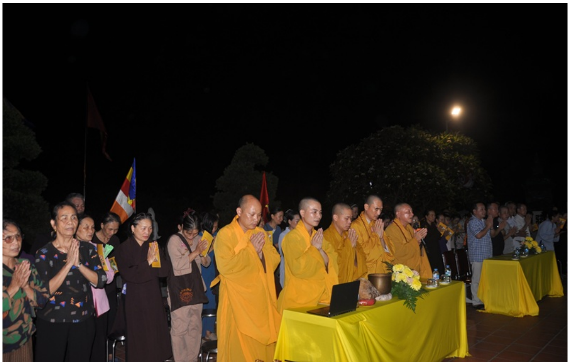
Niệm Phật cầu gia bị

Đại lễ năm nay diễn ra trong bối cảnh đặc biệt khi toàn thể tăng ni, Phật tử cả nước hân hoan đón mừng Phật đản PL.2570 - DL.2026, đồng thời hướng tới dấu mốc 45 năm thành lập Giáo hội Phật giáo Việt Nam . Hòa cùng niềm vui chung toàn dân tộc qua các sự kiện trọng đại như Quốc lễ Giỗ Tổ Hùng Vương và kỷ niệm 136 năm Ngày sinh Chủ tịch Hồ Chí Minh, Đại lễ Phật đản tại chùa Linh Thông càng thêm ý nghĩa, thể hiện tinh thần đồng hành cùng dân tộc của Phật giáo Việt Nam .