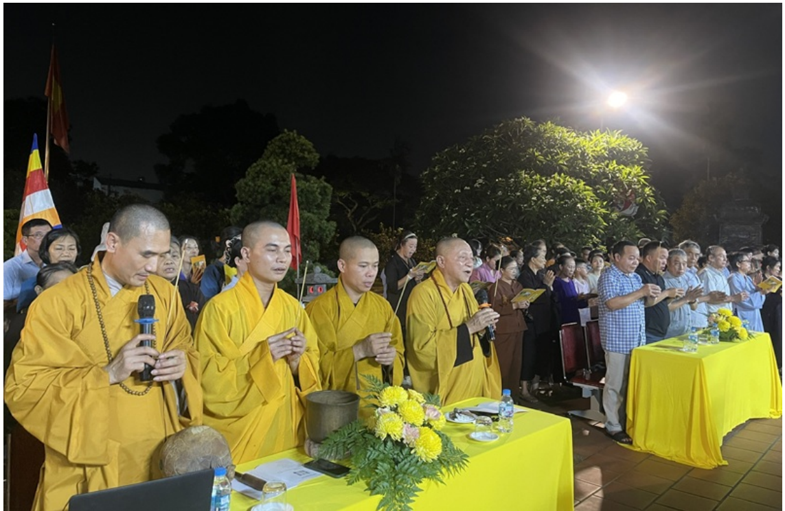
Nghi thức dâng hương

Trong diễn văn khai mạc, Ban Tổ chức nhấn mạnh: Đại lễ Phật đản không chỉ là dịp để tưởng niệm ngày đức Từ Phụ thị hiện nơi cõi Ta bà, mà còn là cơ hội để mỗi người con Phật soi chiếu tự thân, thực hành tinh thần từ bi, hỷ xả, vô ngã, vị tha, góp phần xây dựng đời sống an lạc, hạnh phúc cho gia đình và xã hội.