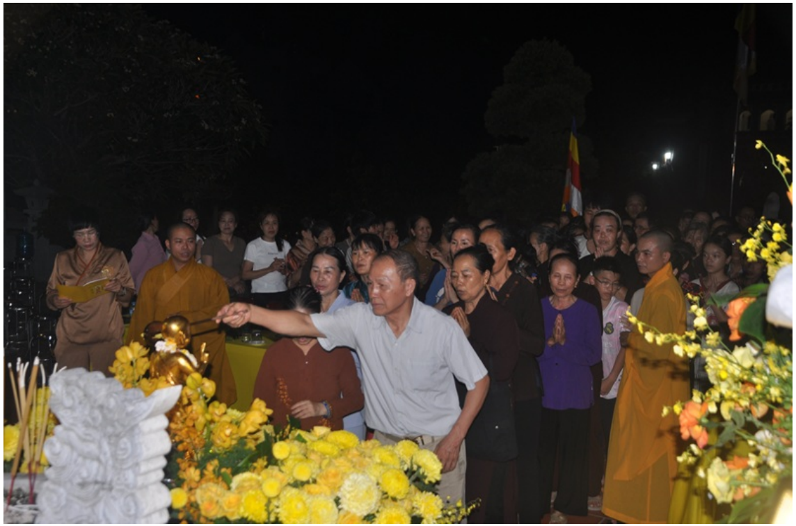
Lễ tắm Phật

Trong niềm thành kính và xúc động, nghi thức dâng hương, tụng kinh Phật dẫn và tắm Phật đã được cử hành trang nghiêm dưới sự chủ lễ của Hòa thượng Thích Gia Quang. Hình ảnh tượng trưng nước thơm tắm kim thân đức Phật sơ sinh như nhắc nhở mỗi người gột rửa phiền não, nuôi dưỡng tâm thanh tịnh và thiện lành.